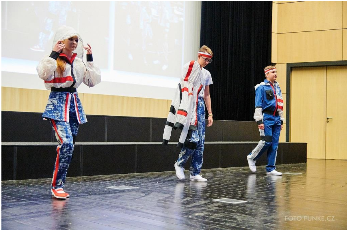
Kolekce Student's power, 3. místo v kategorii Móda sametové revoluce