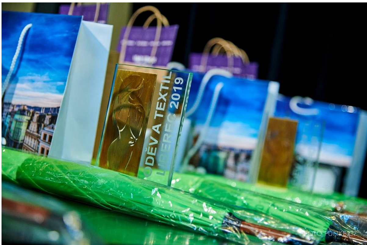
Ceny pro vítěze