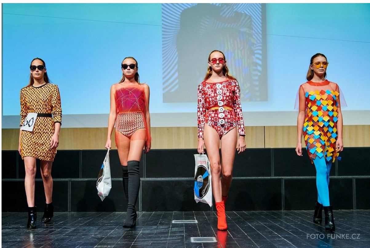
Kolekce Cosmo, 3. místo v kategorii Když šaty vyprávějí