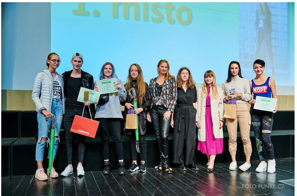
Vyhlášení výsledků kategorie Ženy nosí kalhoty