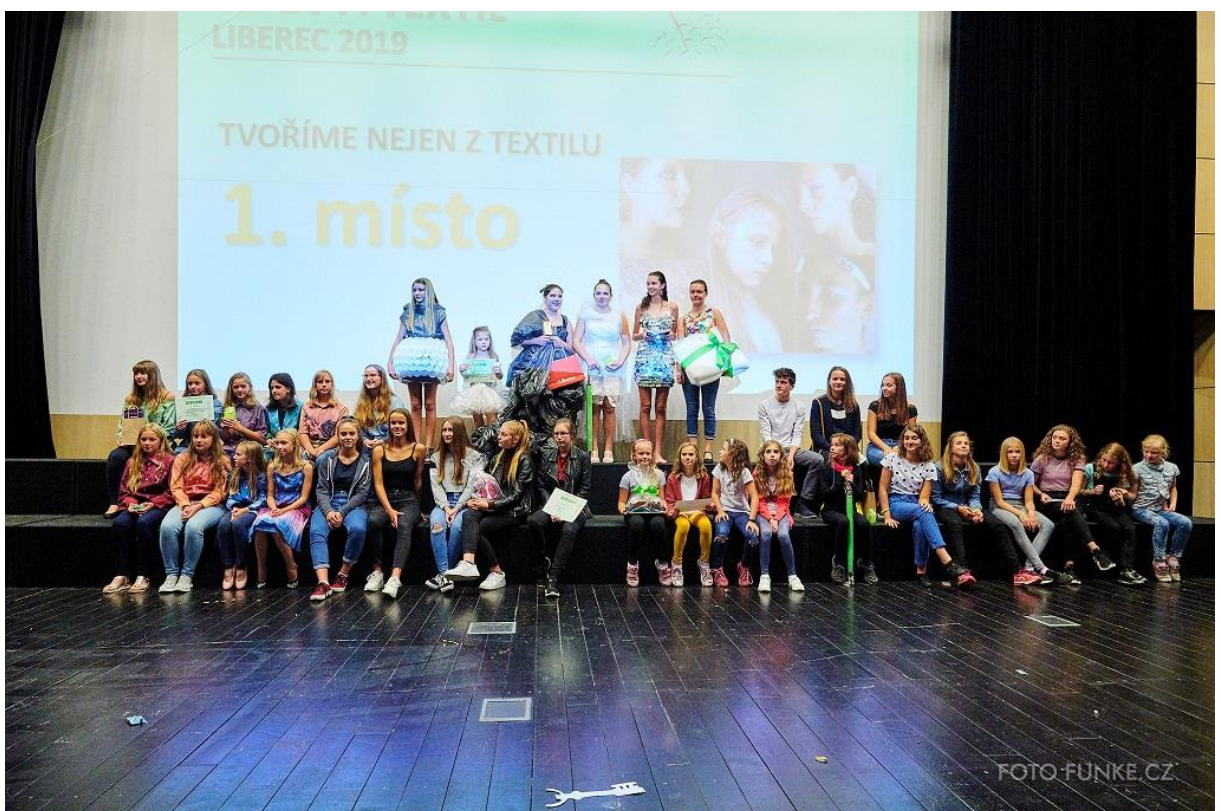
Vyhlášení výsledků kategorie Tvoříme nejen z textilu