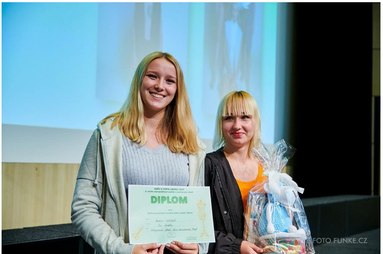
Vyhlášení ceny Spolku pro pořádání soutěže Oděv a textil, Liberec