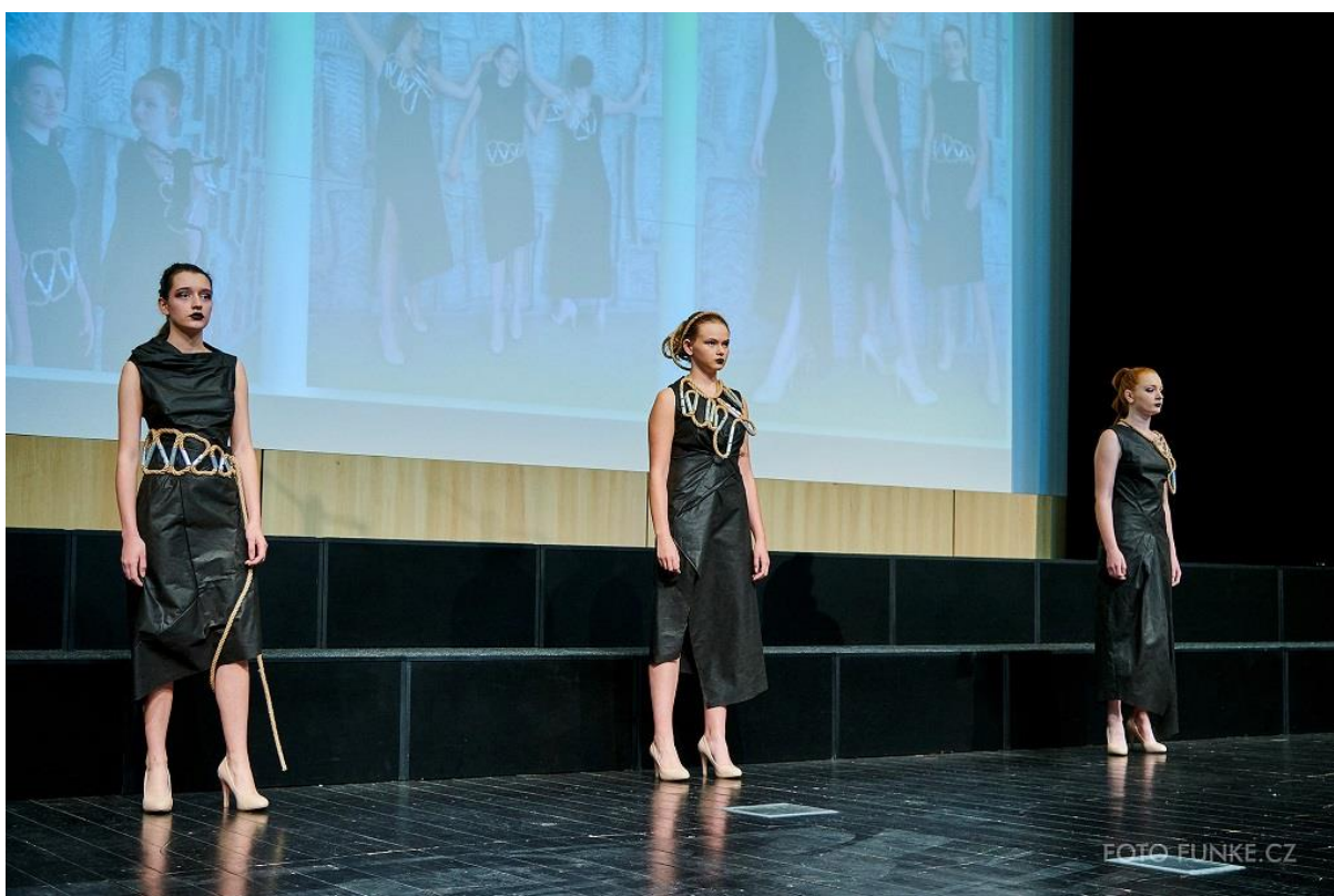
Kolekce Rope a steel, 2. místo v kategorii Když šaty vyprávějí