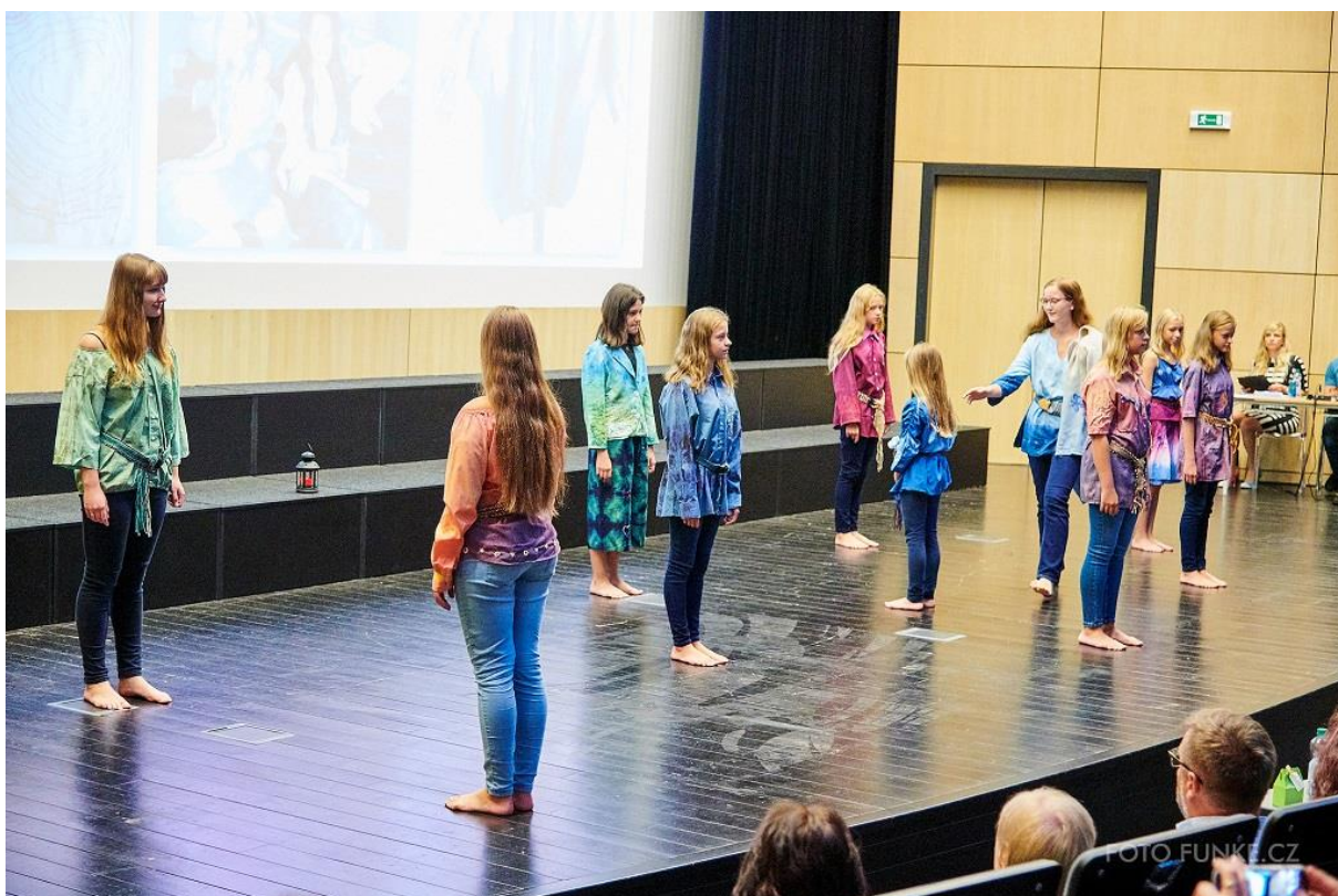
Kolekce Textilní hrátky, 2. místo v kategorii Tvoříme nejen z textilu