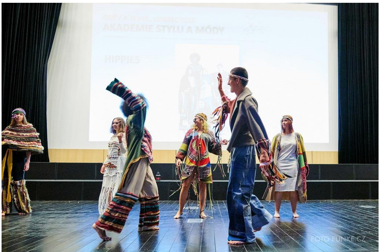
Kolekce Hippies, 2. místo v kategorii Akademie stylu & módy