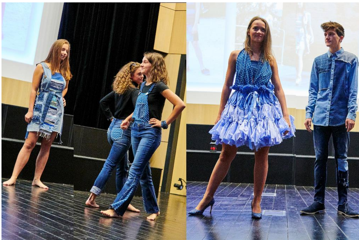
Kolekce Blue(s), 3. místo v kategorii Tvoříme nejen z textilu