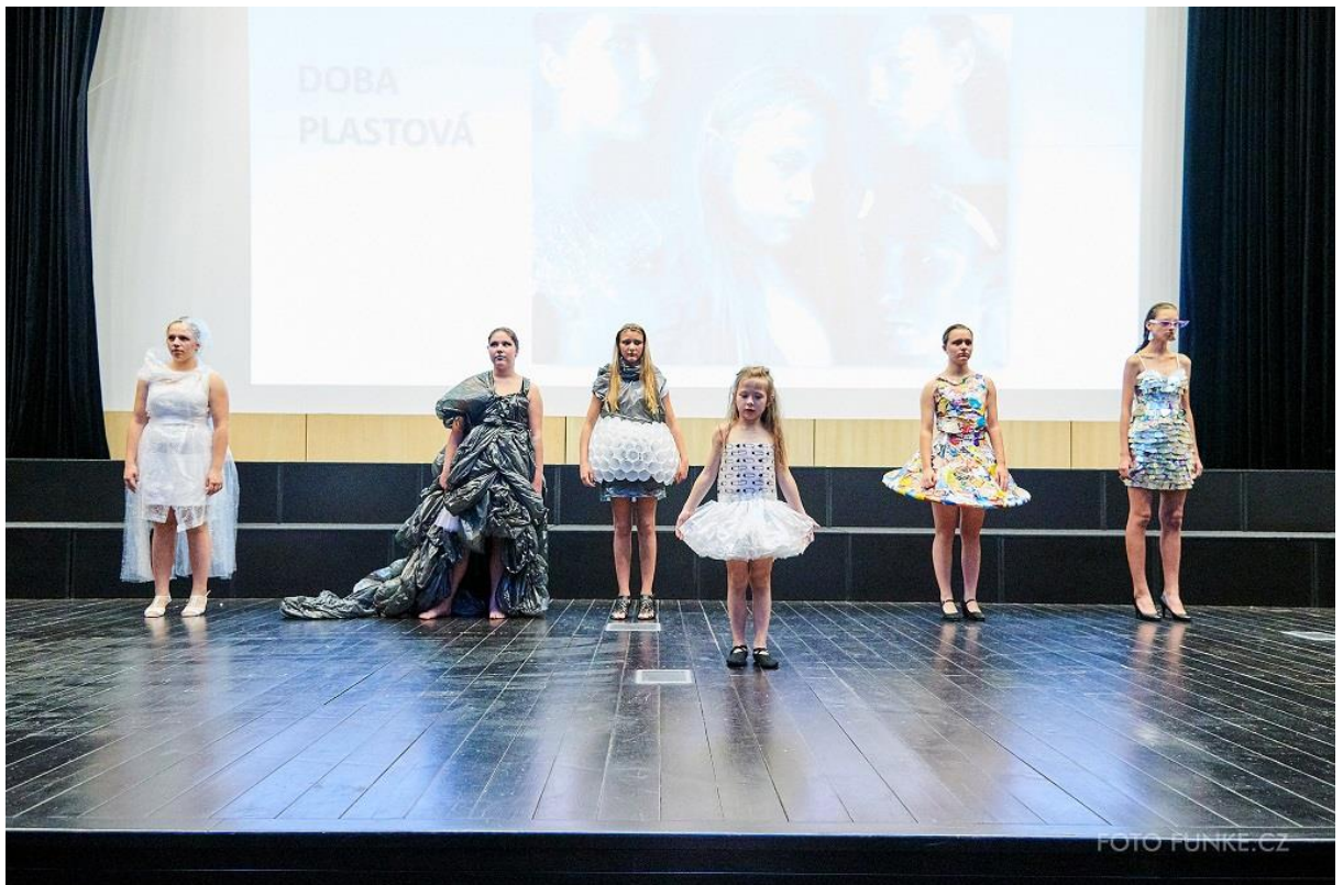
Kolekce Doba plastová, 1. místo v kategorii Tvoříme nejen z textilu