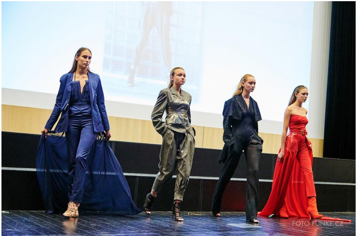
Kolekce Výzva, 1. místo v kategorii Ženy nosí kalhoty