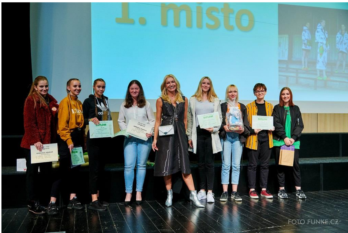
Vyhlášení výsledků kategorie Akademie stylu & módy