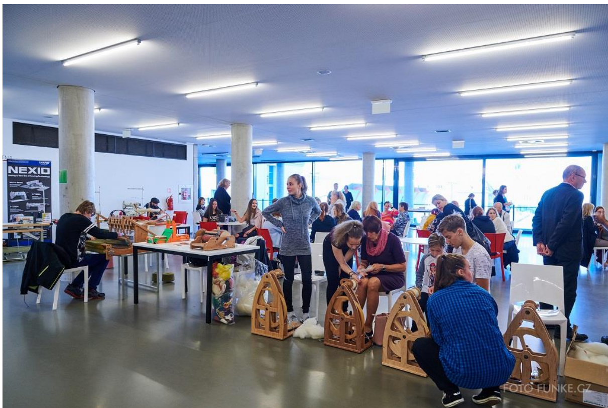
Předsálí během konání soutěže