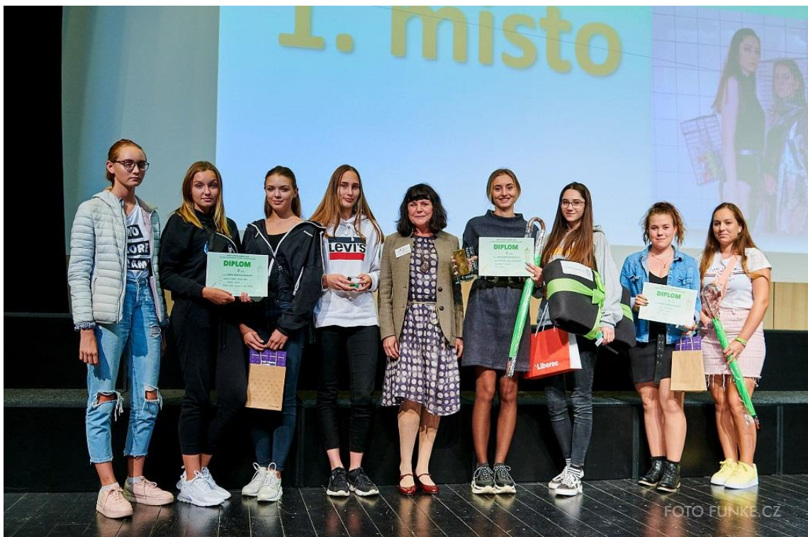
Vyhlášení výsledků kategorie Móda sametové revoluce