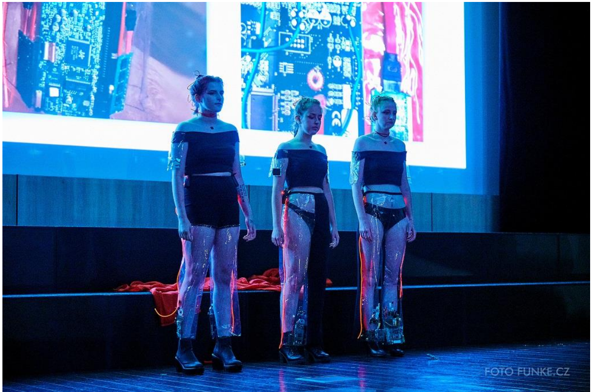
Kolekce Women electric, 3. místo v kategorii Ženy nosí kalhoty