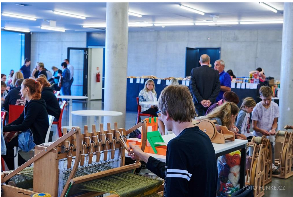
Textilní workshop SPŠT Liberec