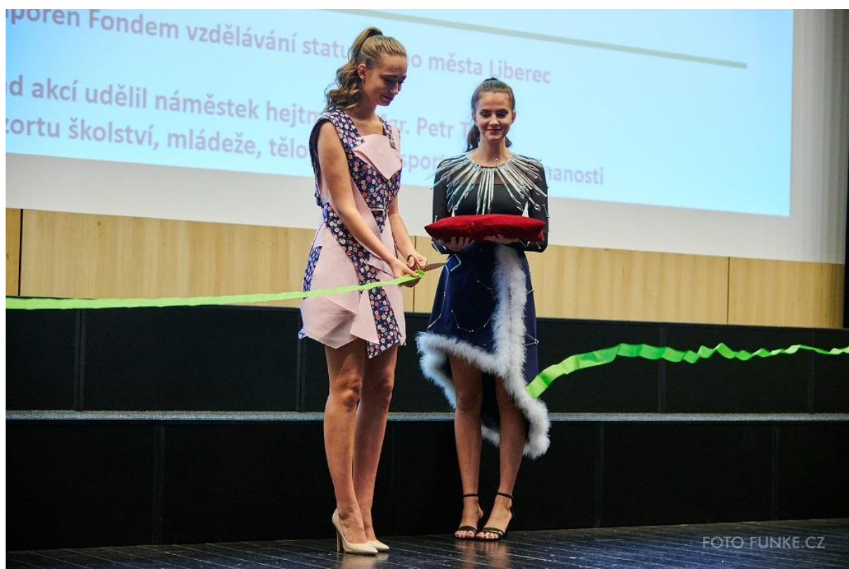
Zahájení soutěže přestřihnutím pásky