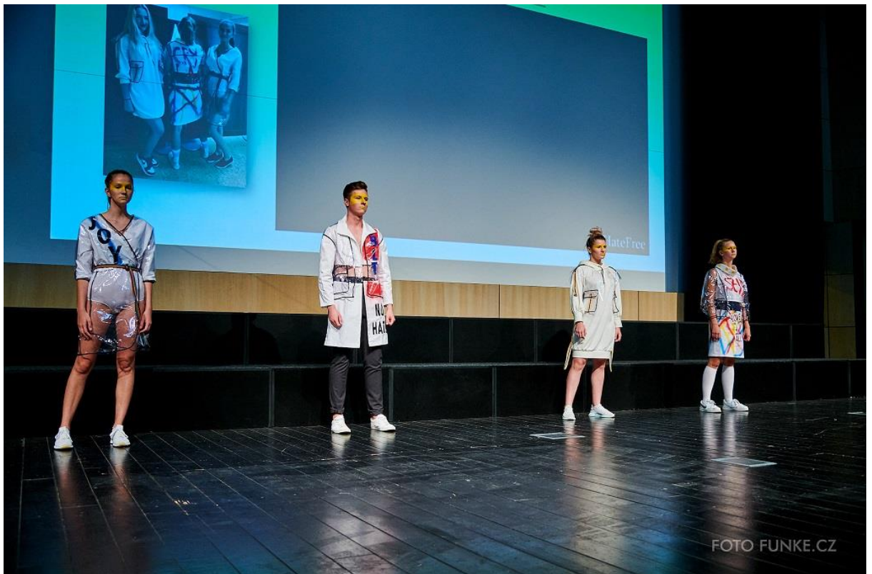
Kolekce Hate Free, 1. místo v kategorii Když šaty vyprávějí