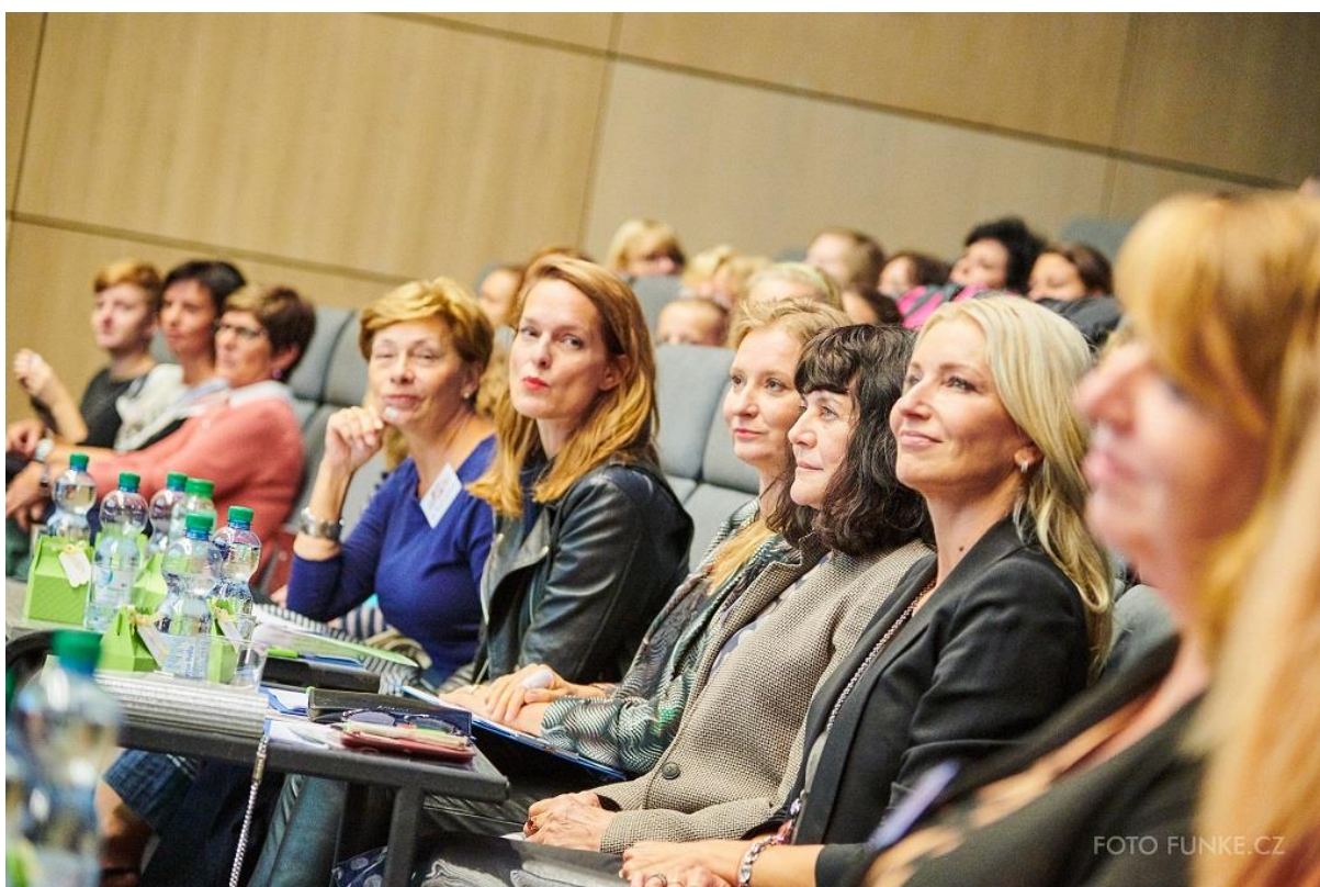
Soutěžící hodnotila porota složená nejen z odborníků v oblasti oděvnictví a textilnictví