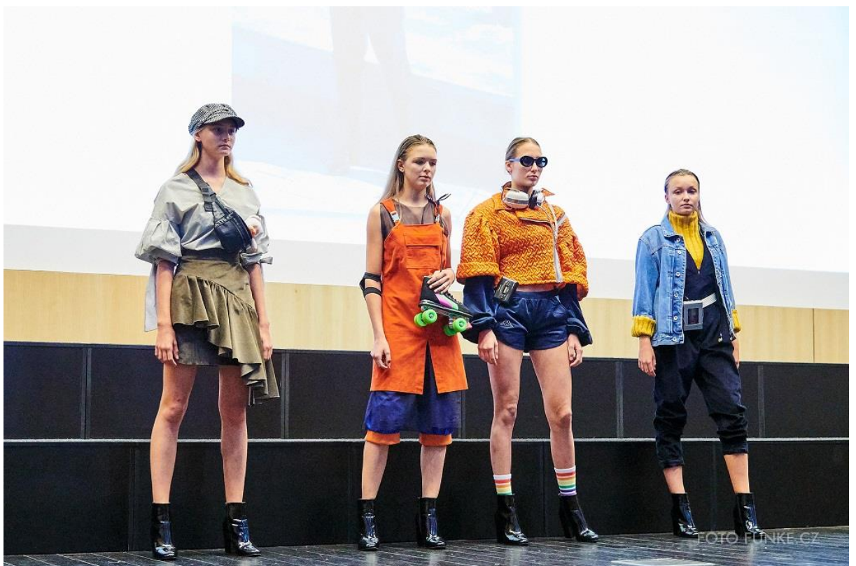
Kolekce Druhá šance, 2. místo v kategorii Móda sametové revoluce