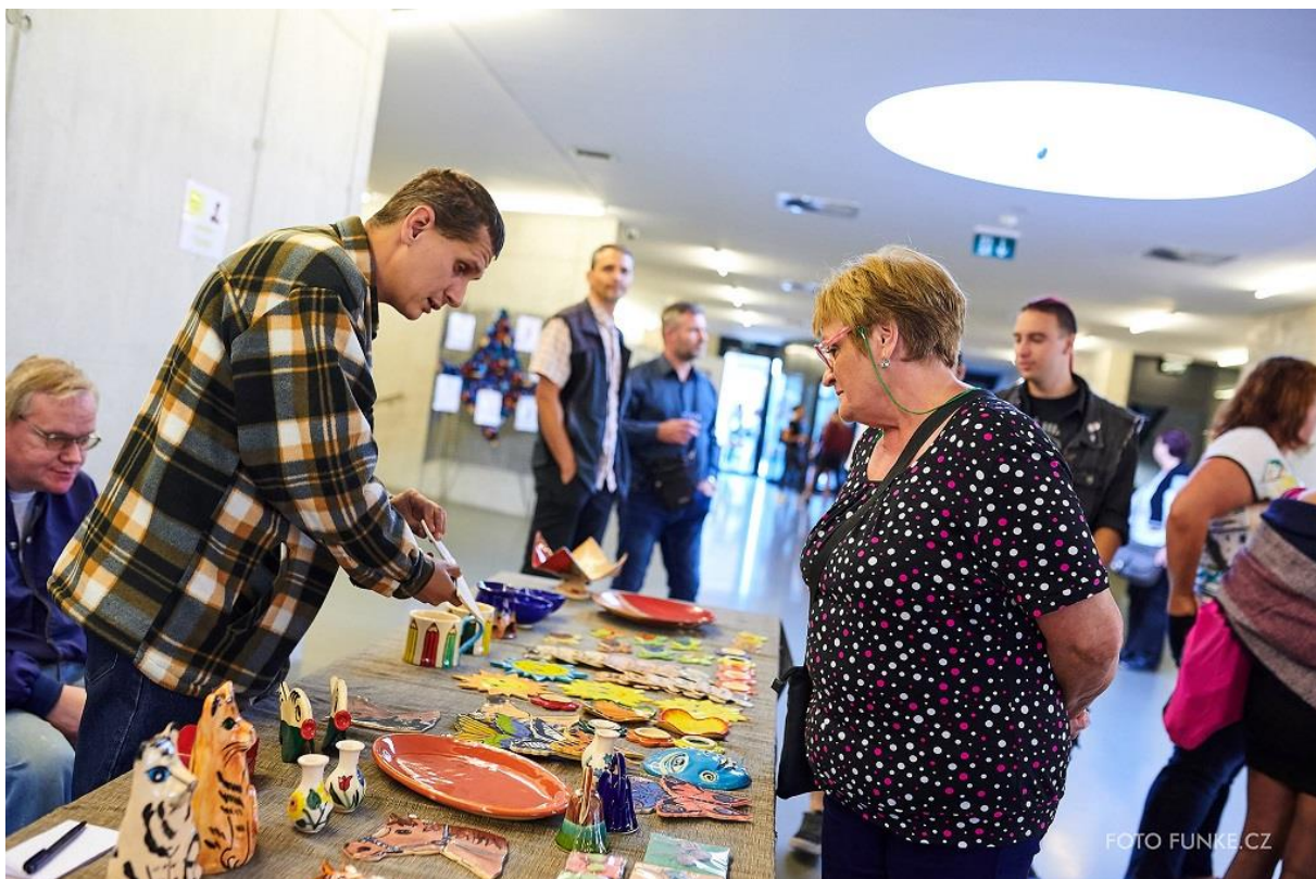
Doprovodný program - ukázka práce Sdružení TULIPAN