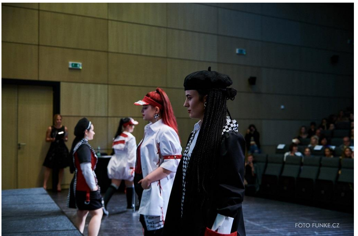
Kolekce Take order, 1. místo v kategorii Ne, nejsem štíhlá