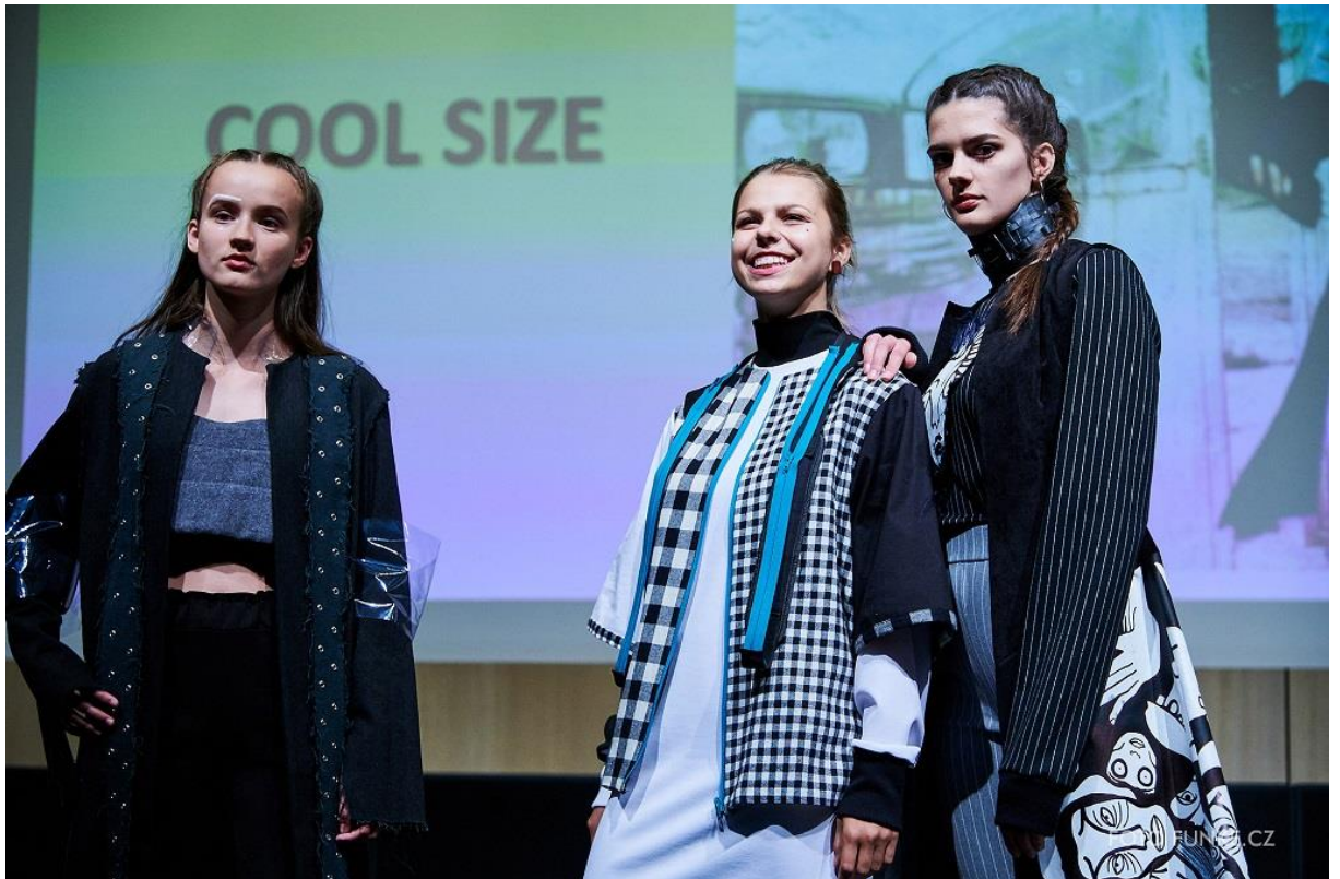
Kolekce Cool size, 2. místo v kategorii Ne, nejsem štíhlá