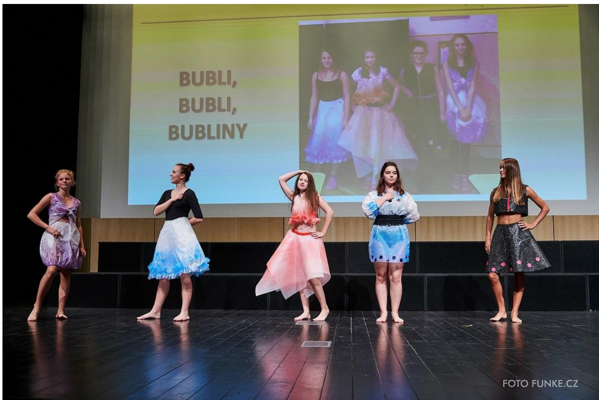
Kolekce Bubli, bubli, bubliny, 3. místo v kategorii Tvoříme nejen z textilu