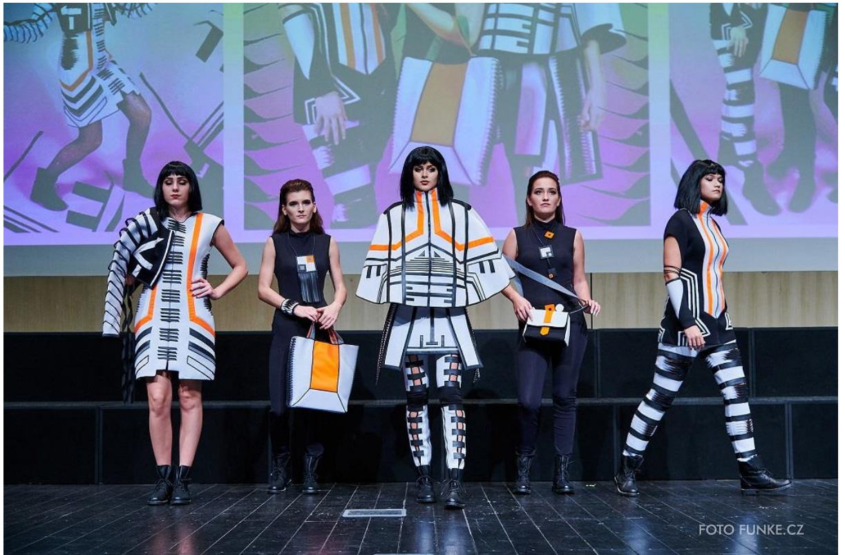
Kolekce Distinctive, 1. místo v kategorii Sen