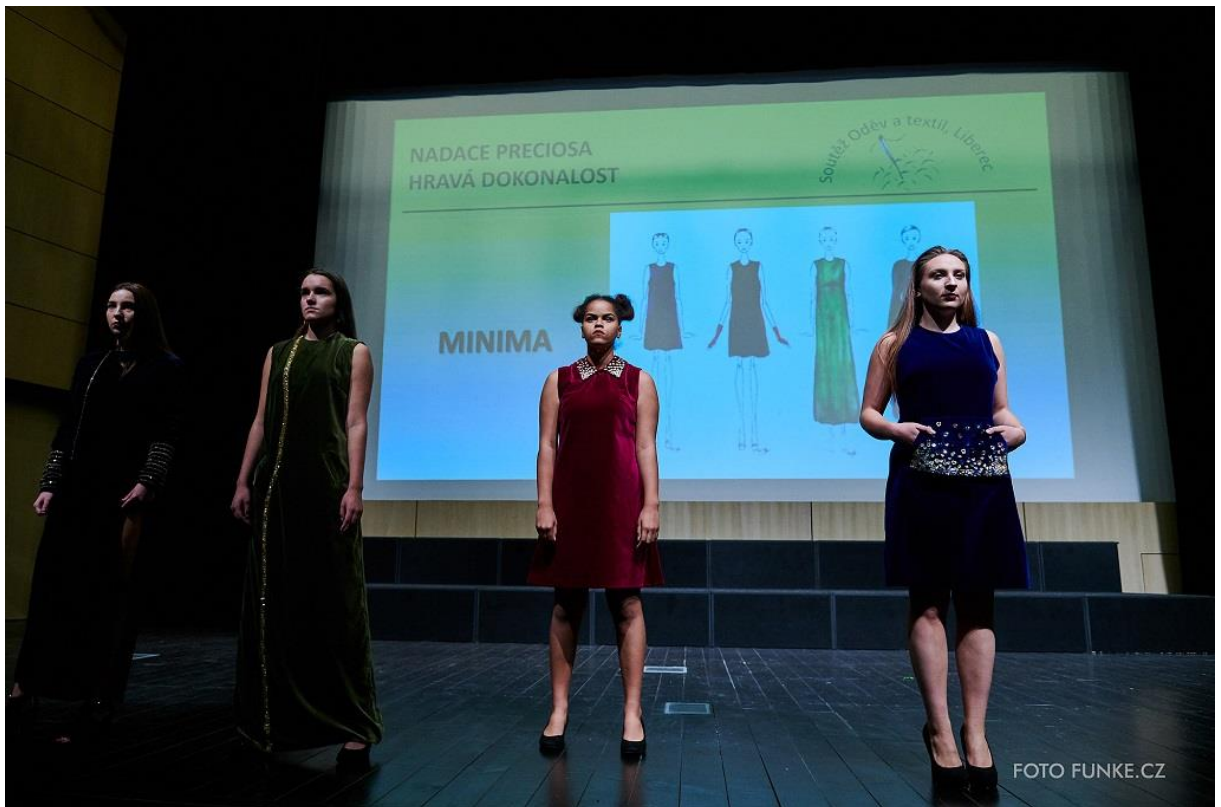
Kolekce Minima, 1. místo v kategorii Nadace Preciosa