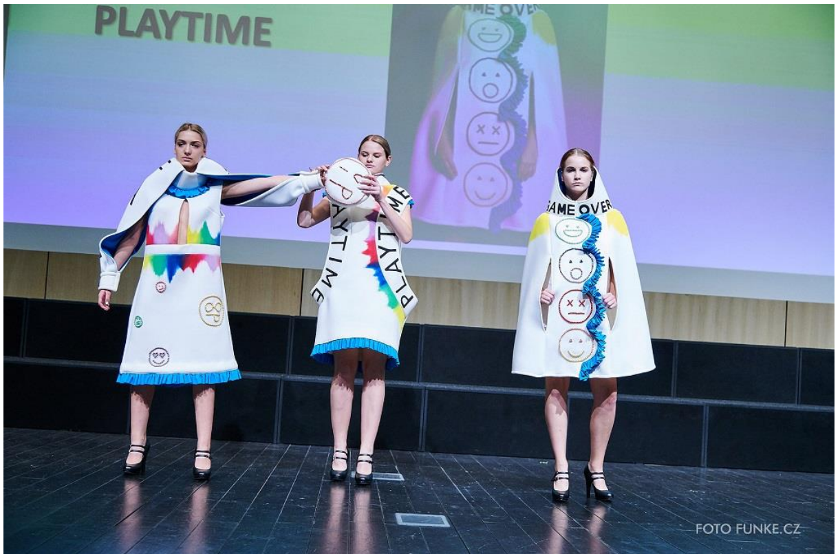
Kolekce Playtime, 3. místo v kategorii Sen