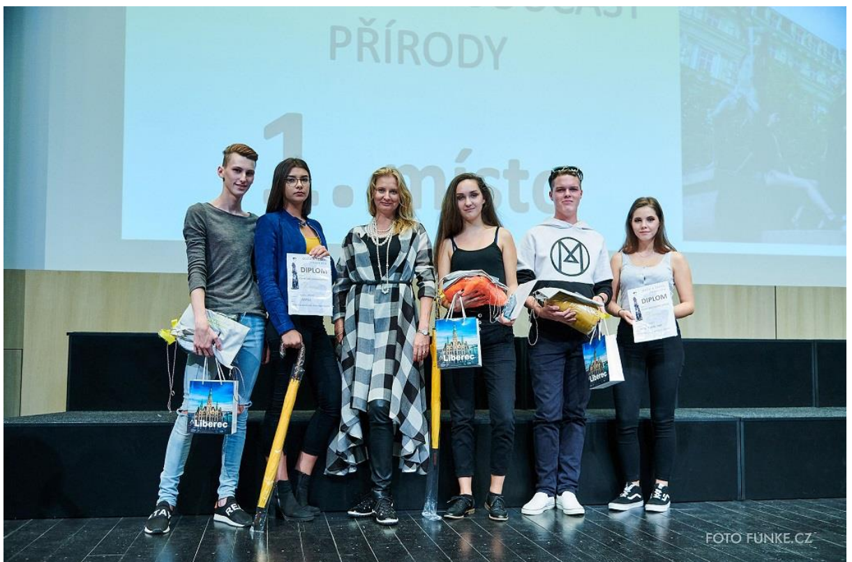
Vyhlášení výsledků kategorie Člověk jako součást přírody