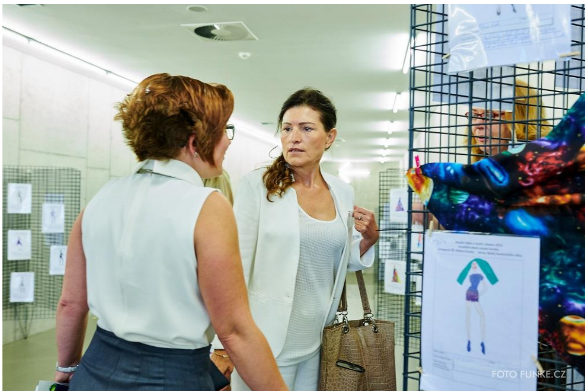
Výstava návrhů zaslanych do kategorie Módní kresba