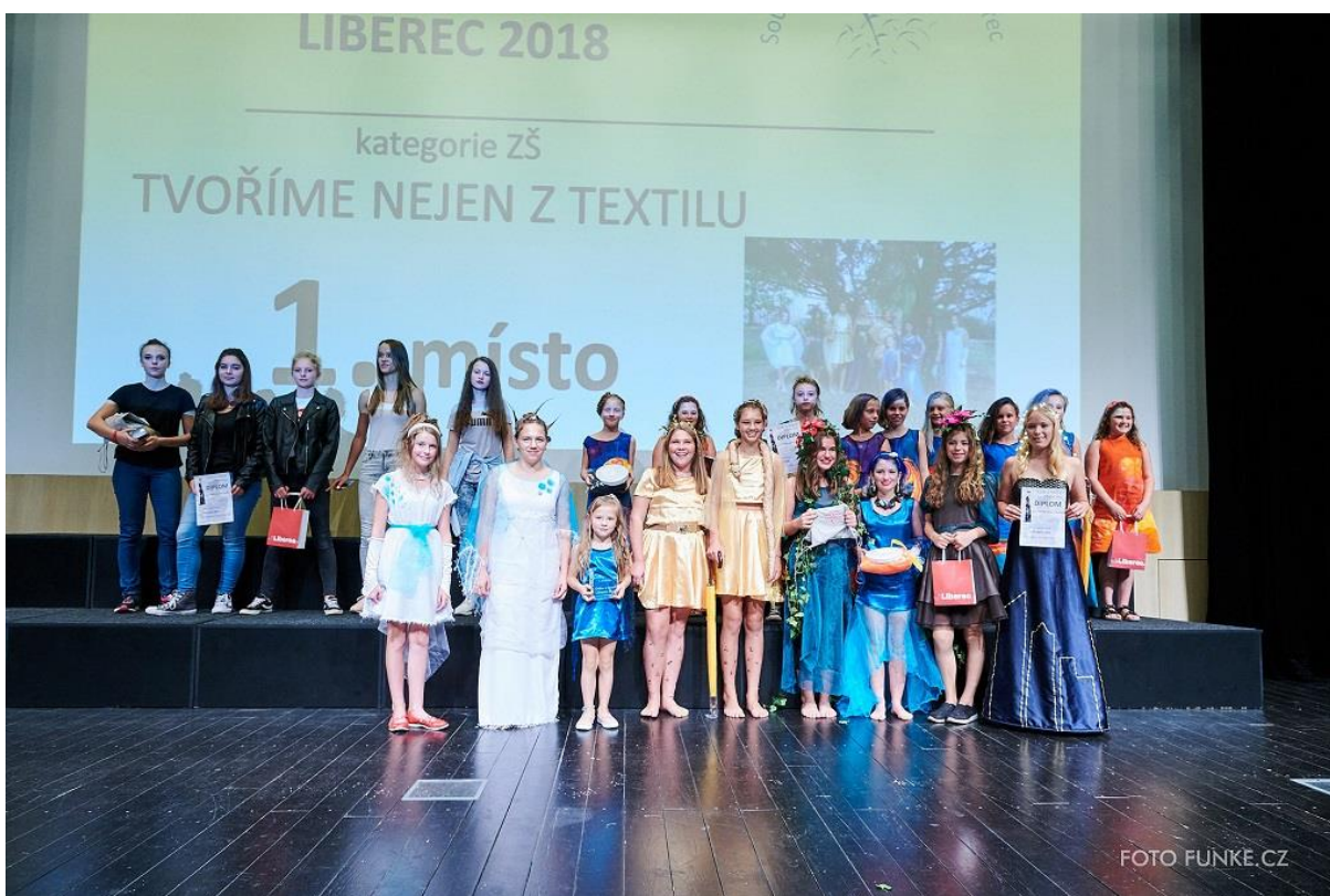
Vyhlášení výsledků kategorie Tvoříme nejen z textilu