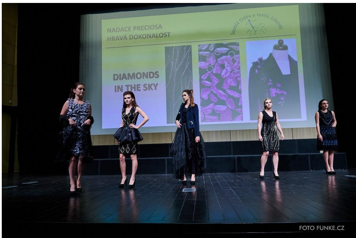
Kolekce Diamonds in the sky, 3. místo v kategorii Nadace Preciosa