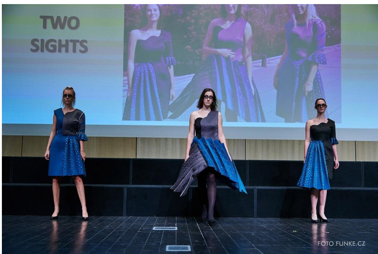
Kolekce Two sights, 2. místo v kategorii Nadace Preciosa