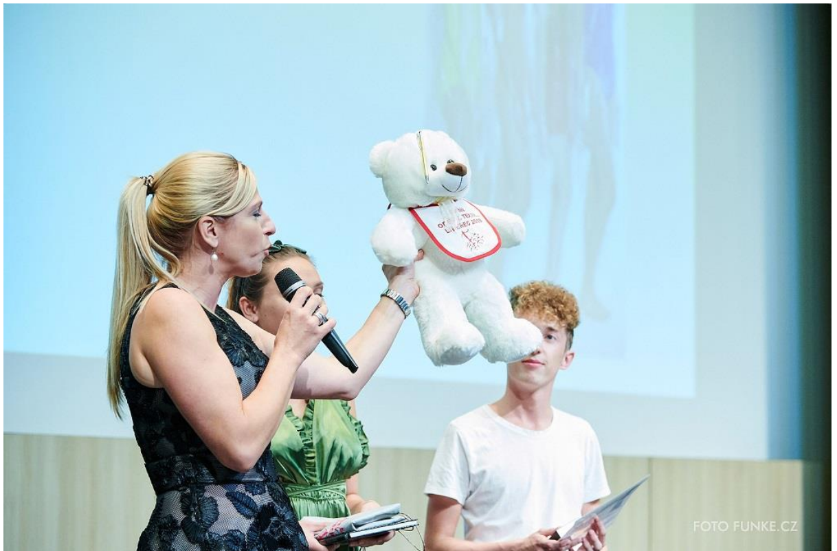
Vyhlášení ceny Spolku pro pořádání soutěže Oděv a textil, Liberec