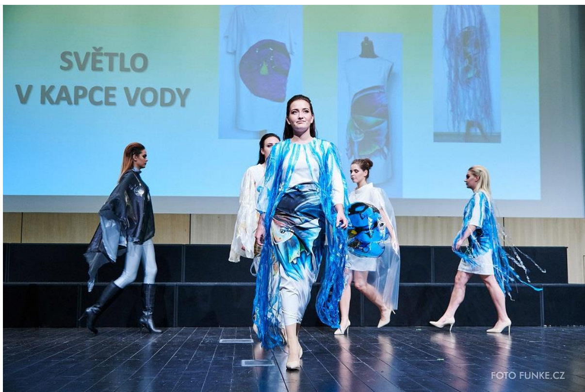
Kolekce Světlo v kapce vody, 3. místo v kategorii Člověk jako součást přírody