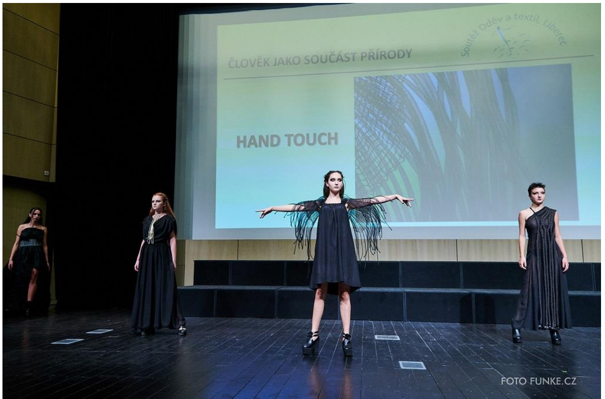
Kolekce Hand touch, 1. místo v kategorii Člověk jako součást přírody