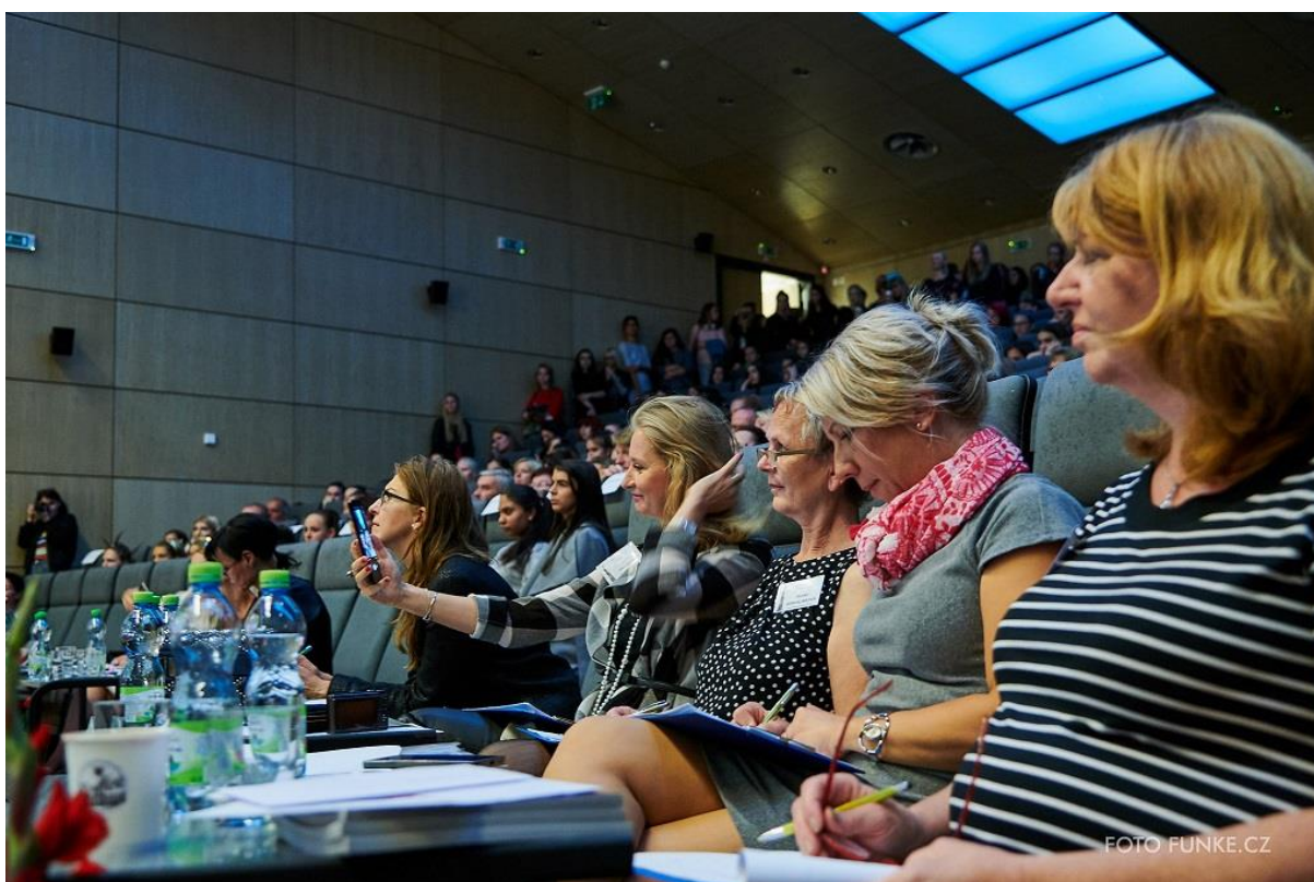
Soutěžící hodnotila porota složená nejen z odborníků v oblasti oděvnictví a textilnictví