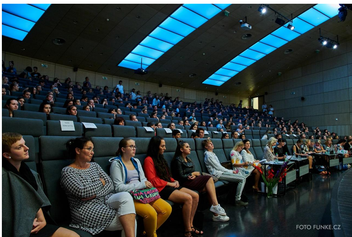
Aula budovy G TUL během konání soutěže