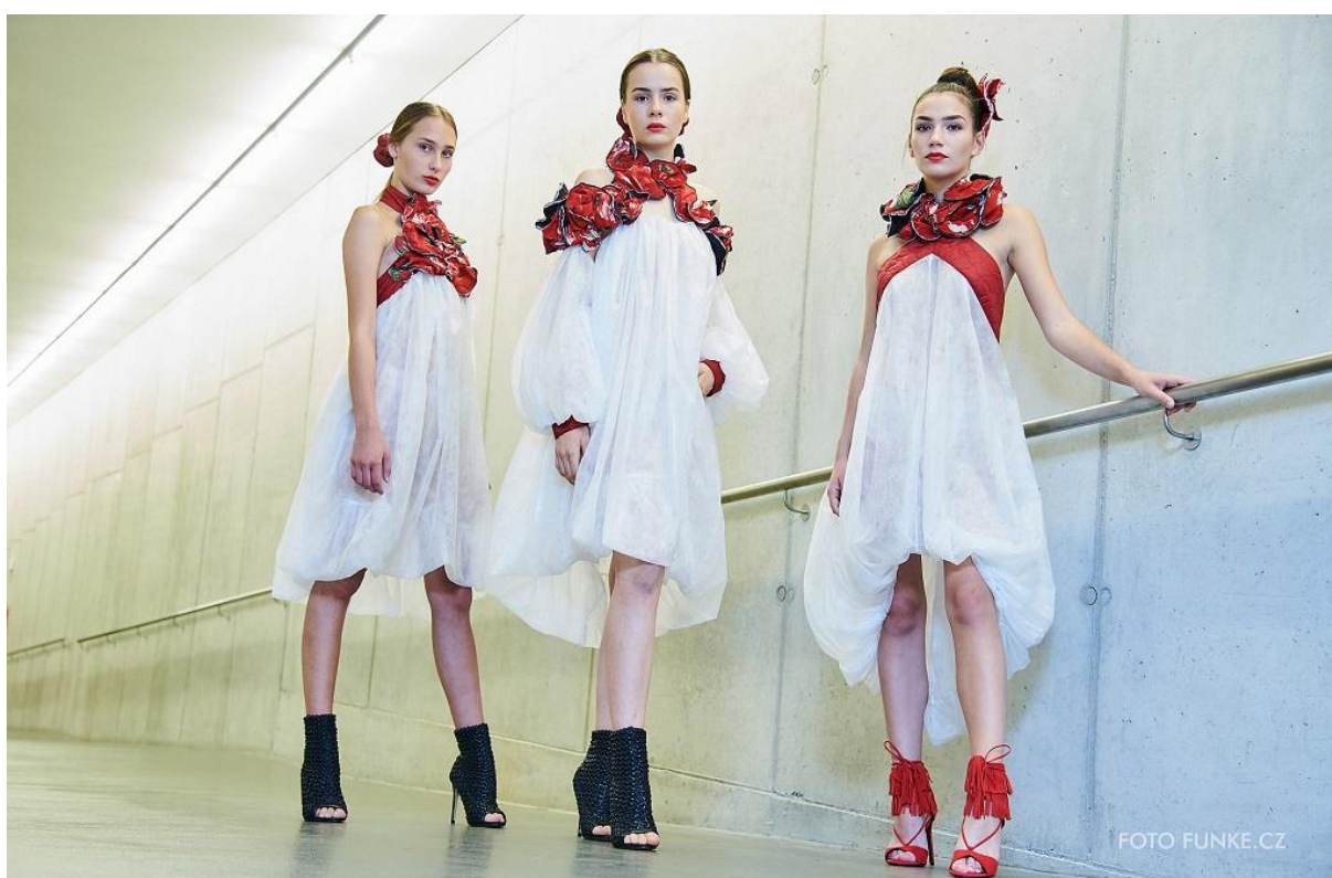
Kolekce Poppies, 2. místo v kategorii Člověk jako součást přírody