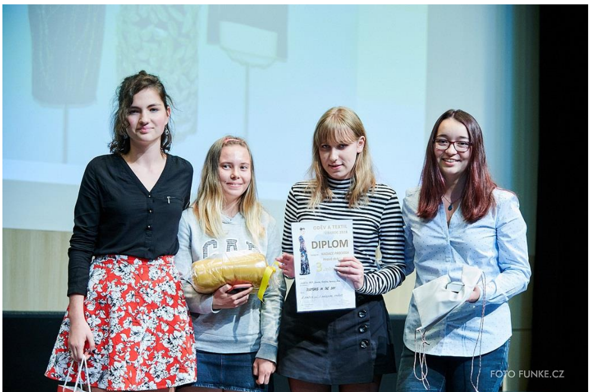
Vyhlášení výsledků kategorie Nadace Preciosa na téma Hravá dokonalost