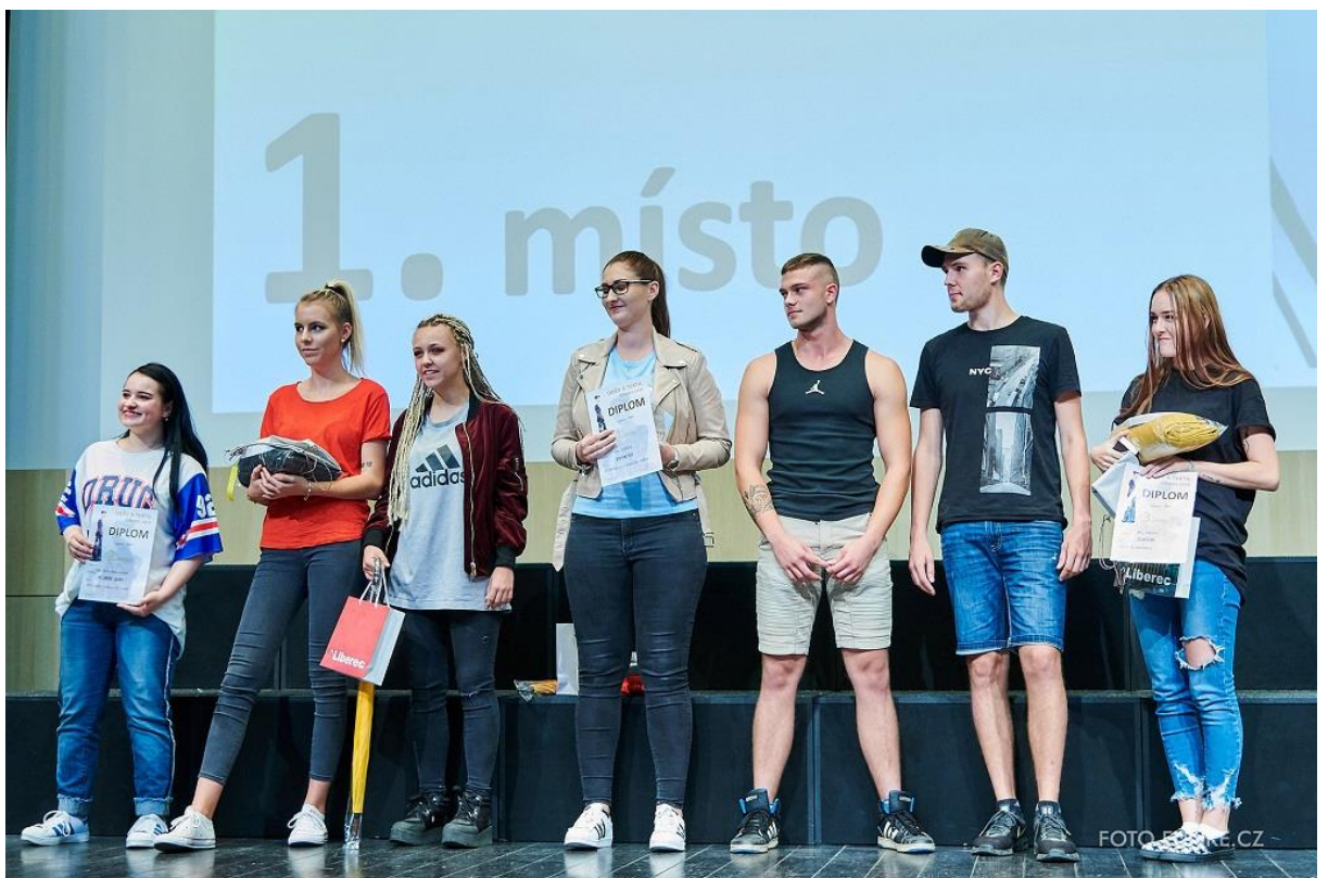
Vyhlášení výsledků kategorie Sen