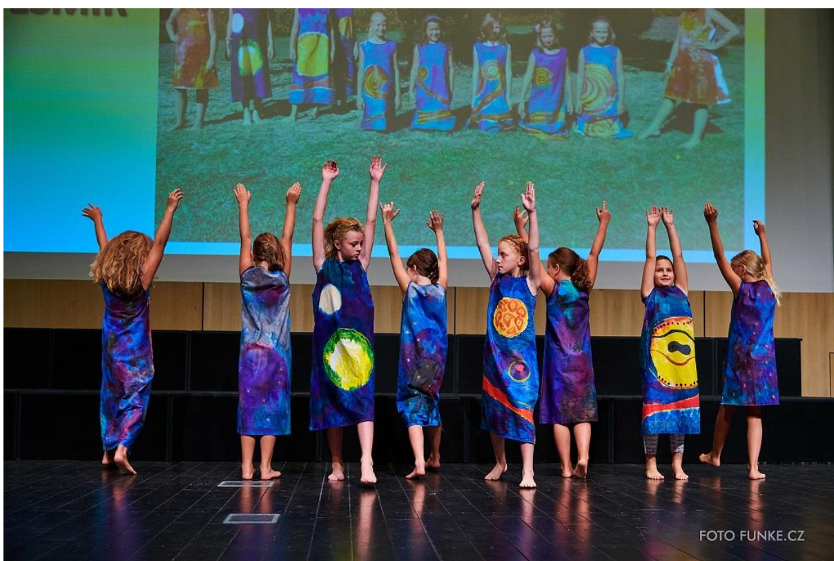
Kolekce Vesmír, 2. místo v kategorii Tvoříme nejen z textilu