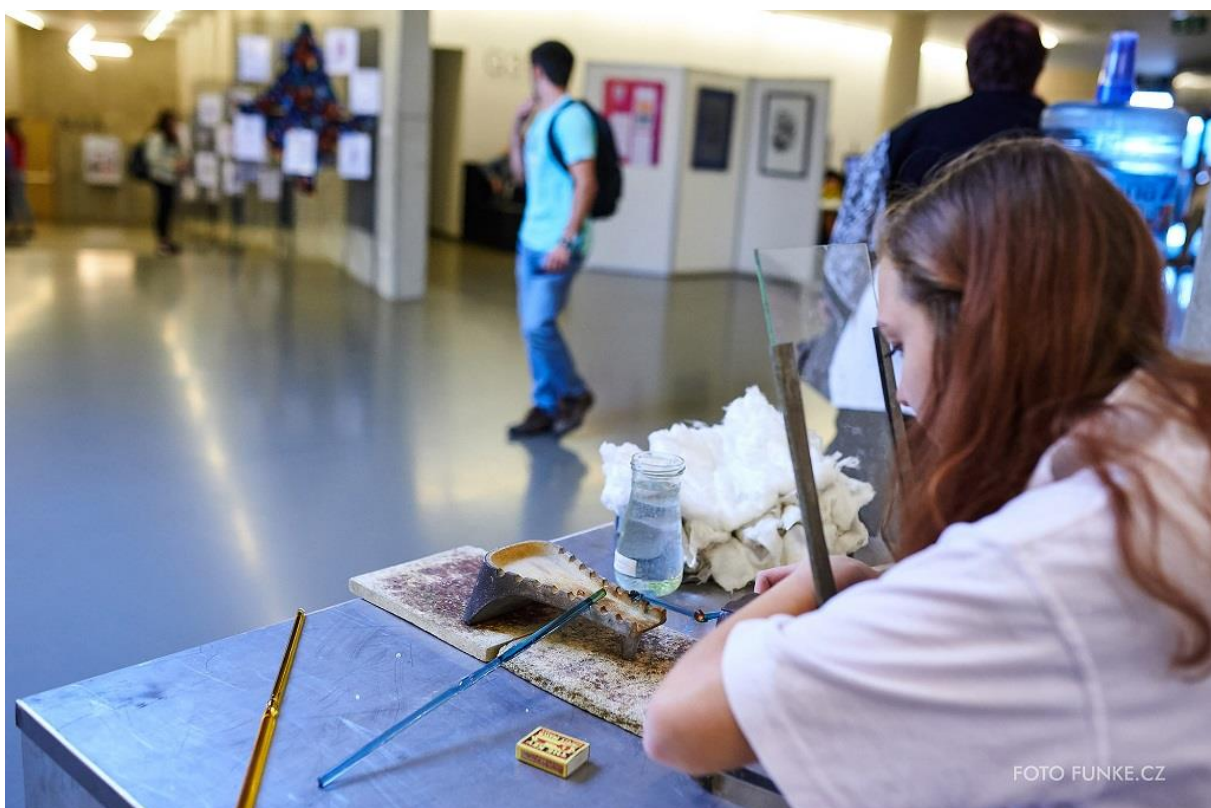
Doprovodný program - výroba bižuterie