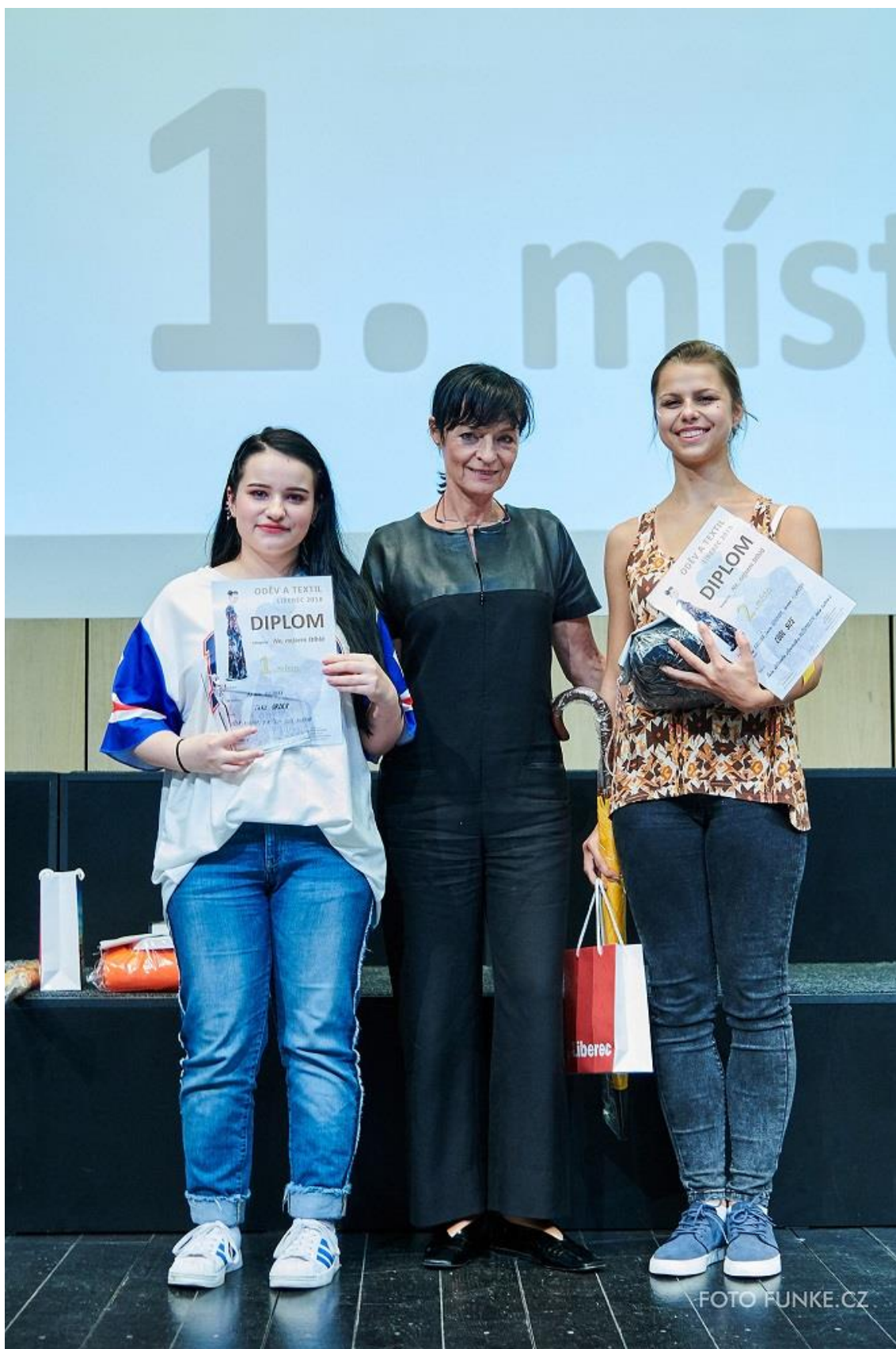
Vyhlášení výsledků kategorie Ne, nejsem štíhlá