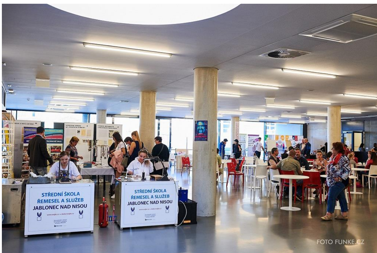
Celým dnem již tradičně provázela známá moderátorka Lucie Fürstová