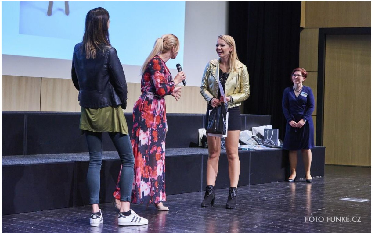
Cena Krajské vědecké knihovny Liberec