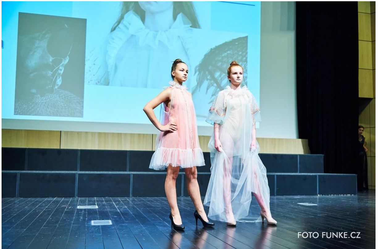
Kolekce Jarní sonáta, 3. místo v kategorii Luxus a ryzí ženskost