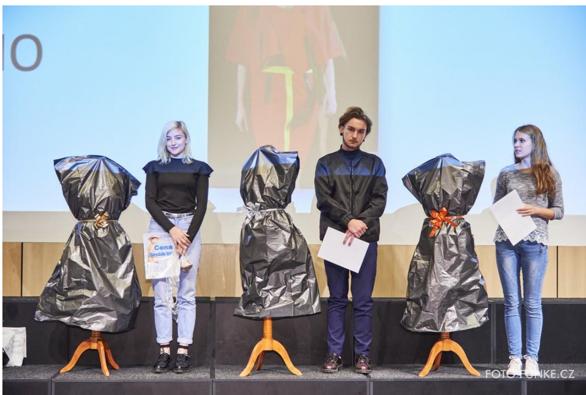
Vyhlášení cen Libereckého kraje