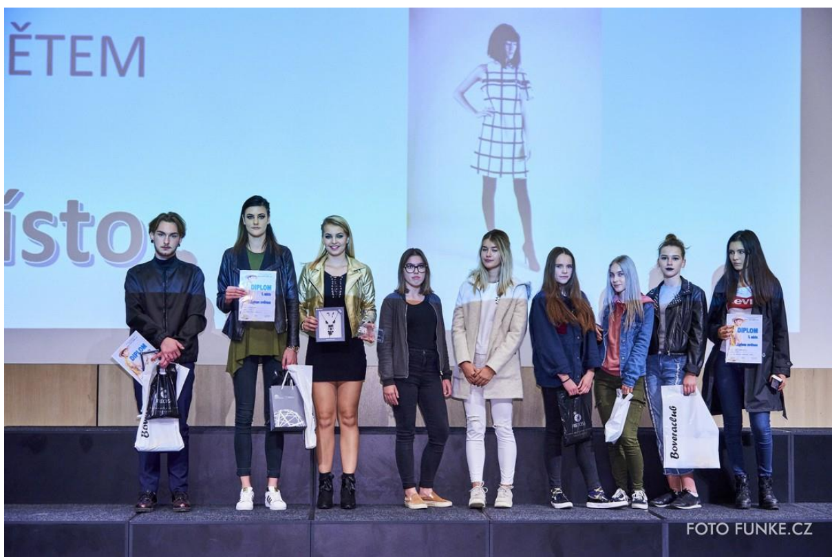
Vyhlášení výsledků kategorie Letem světem