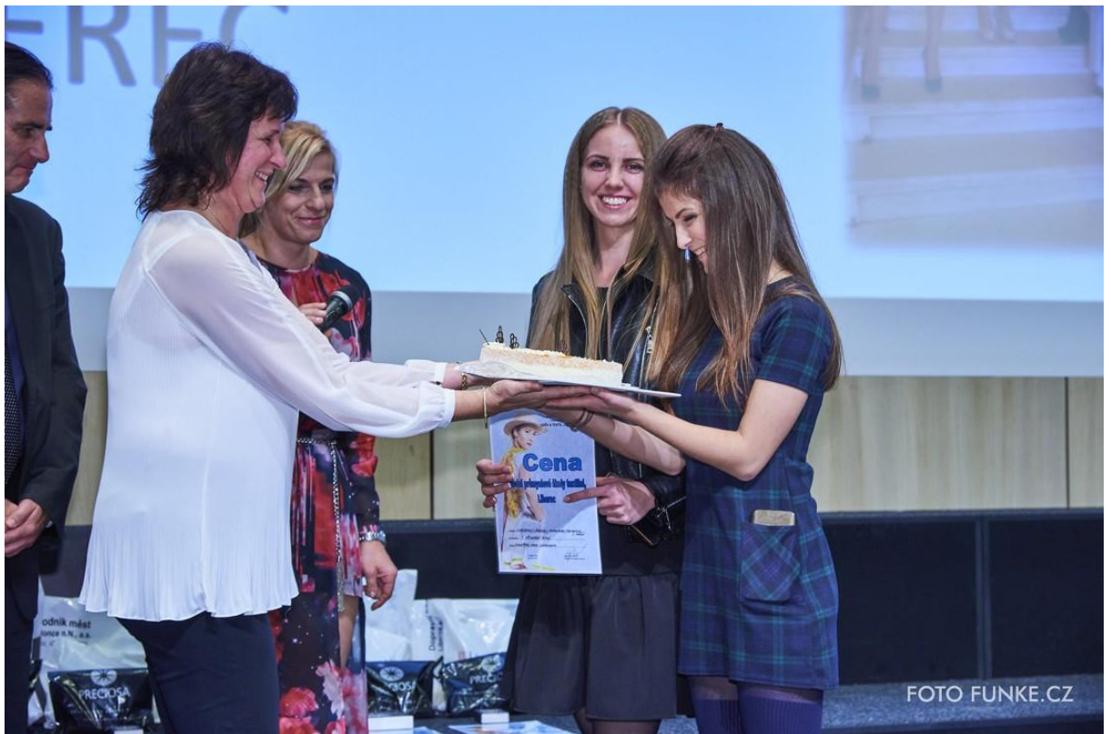
Cena Střední průmyslové školy textilní, Liberec