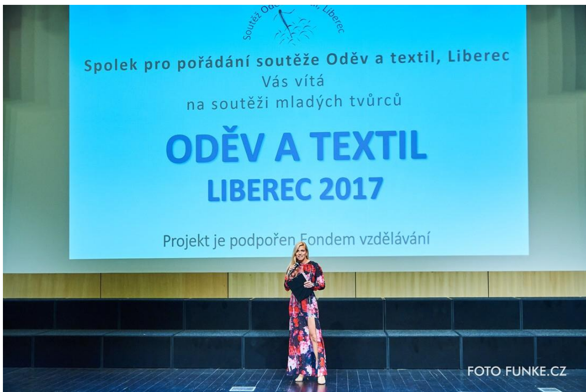
Celým dnem provázela známá moderátorka Lucie Fürstová