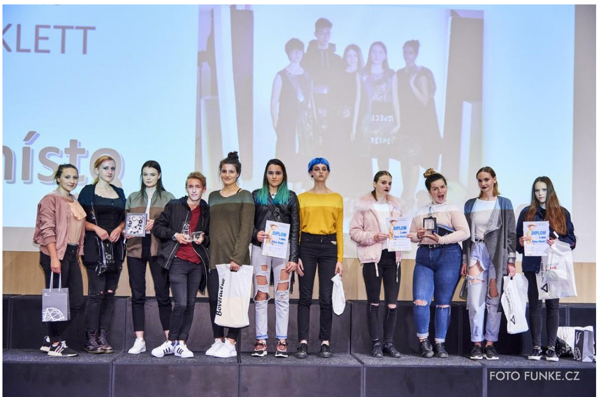
Vyhlášení výsledků kategorie JITKA KLETT na téma Multikulturalismus v oděvní tvorbě