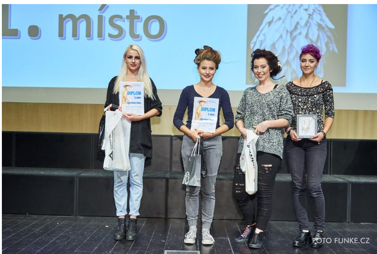
Vyhlášení výsledků kategorie Nepovinná četba