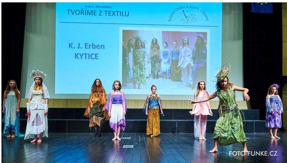
Vítězná kolekce kategorie Tvoříme z textilu K. J. Erben: Kytice