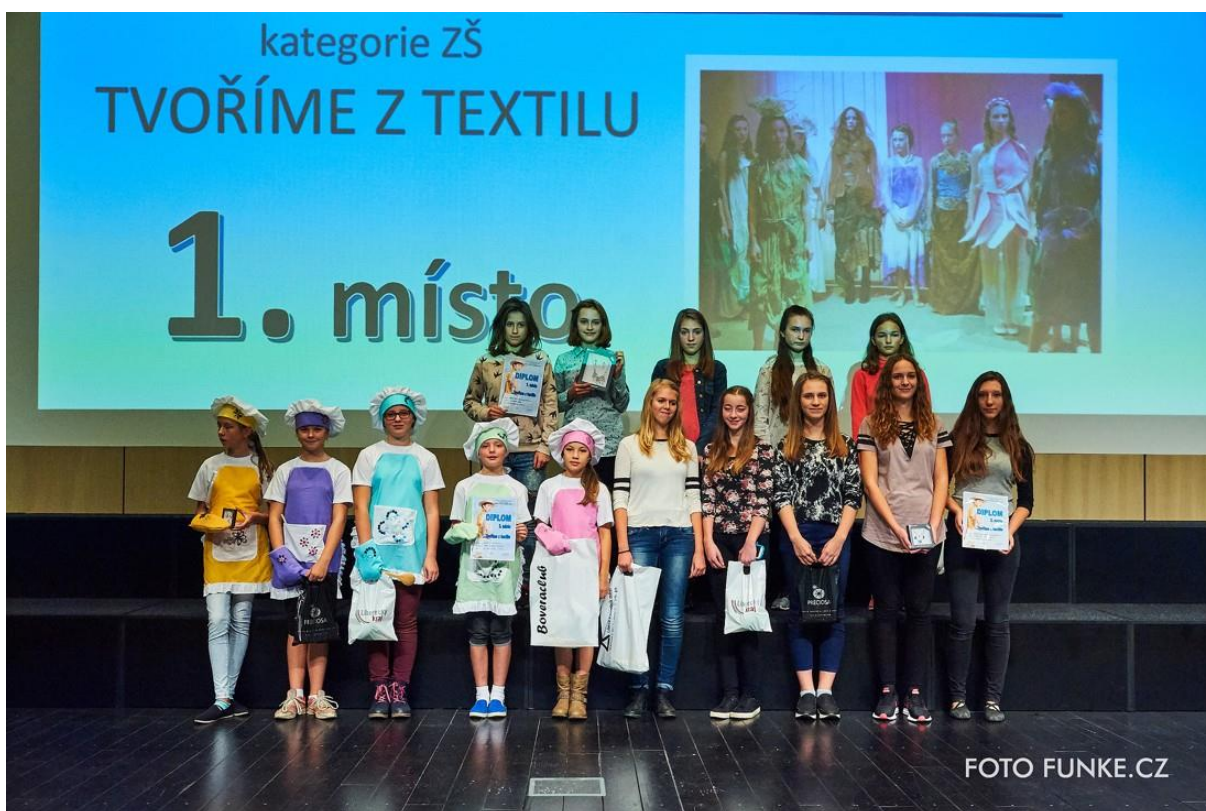
Vyhlášení výsledků kategorie Tvoříme z textilu