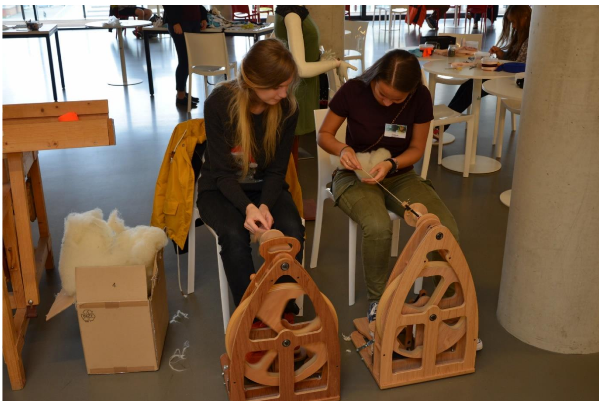
Doprovodný program - textilní workshop