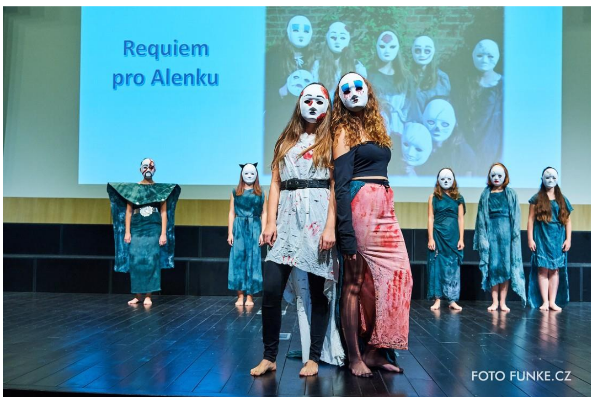
Kolekce Requiem pro Alenku, která dosáhla druhého místa