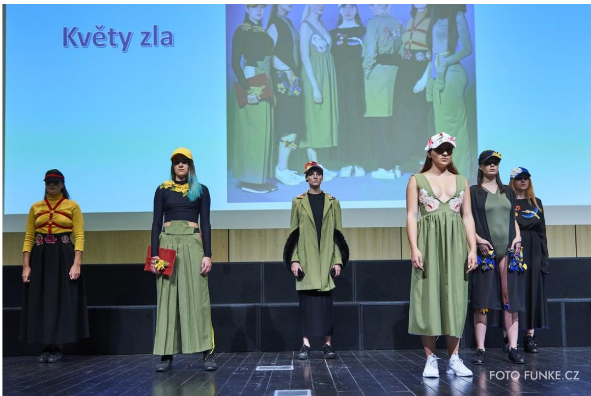
Kolekce Květy zla, 3. místo v kategorii Nepovinná četba