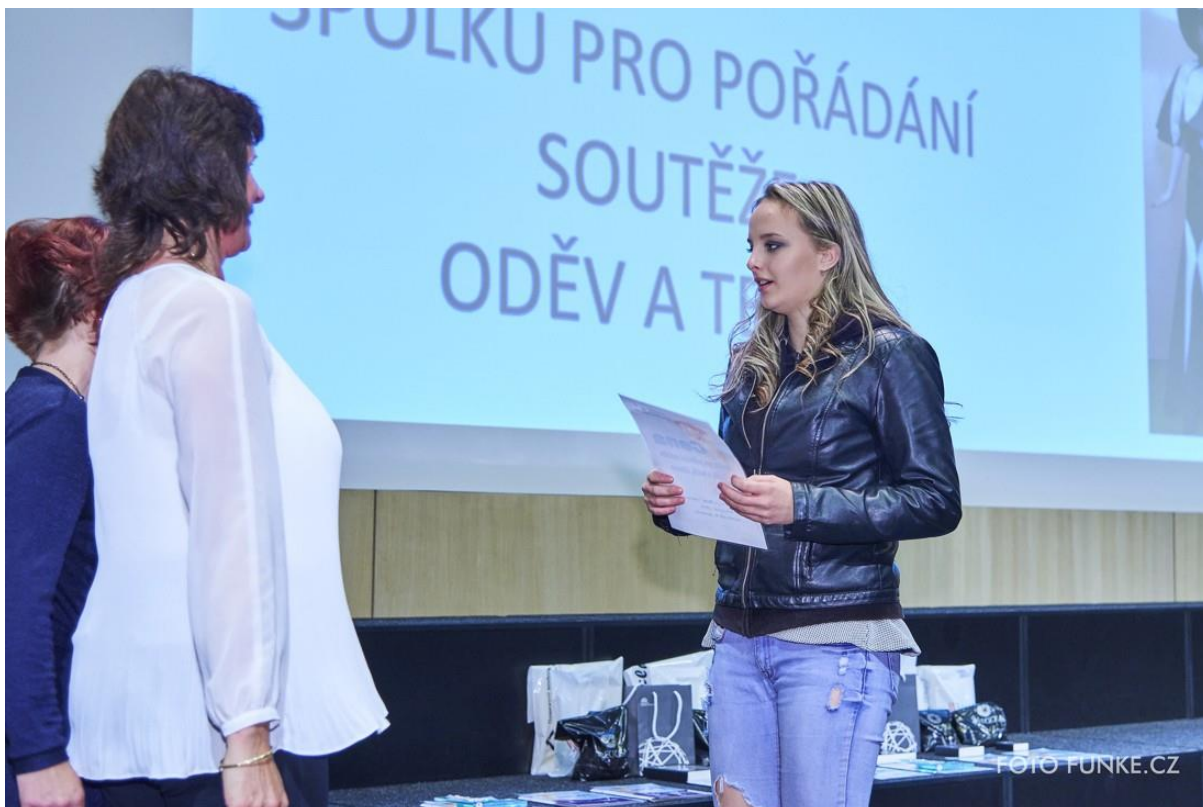
Cena Spolku pro pořádání soutěže Oděv a textil, Liberec