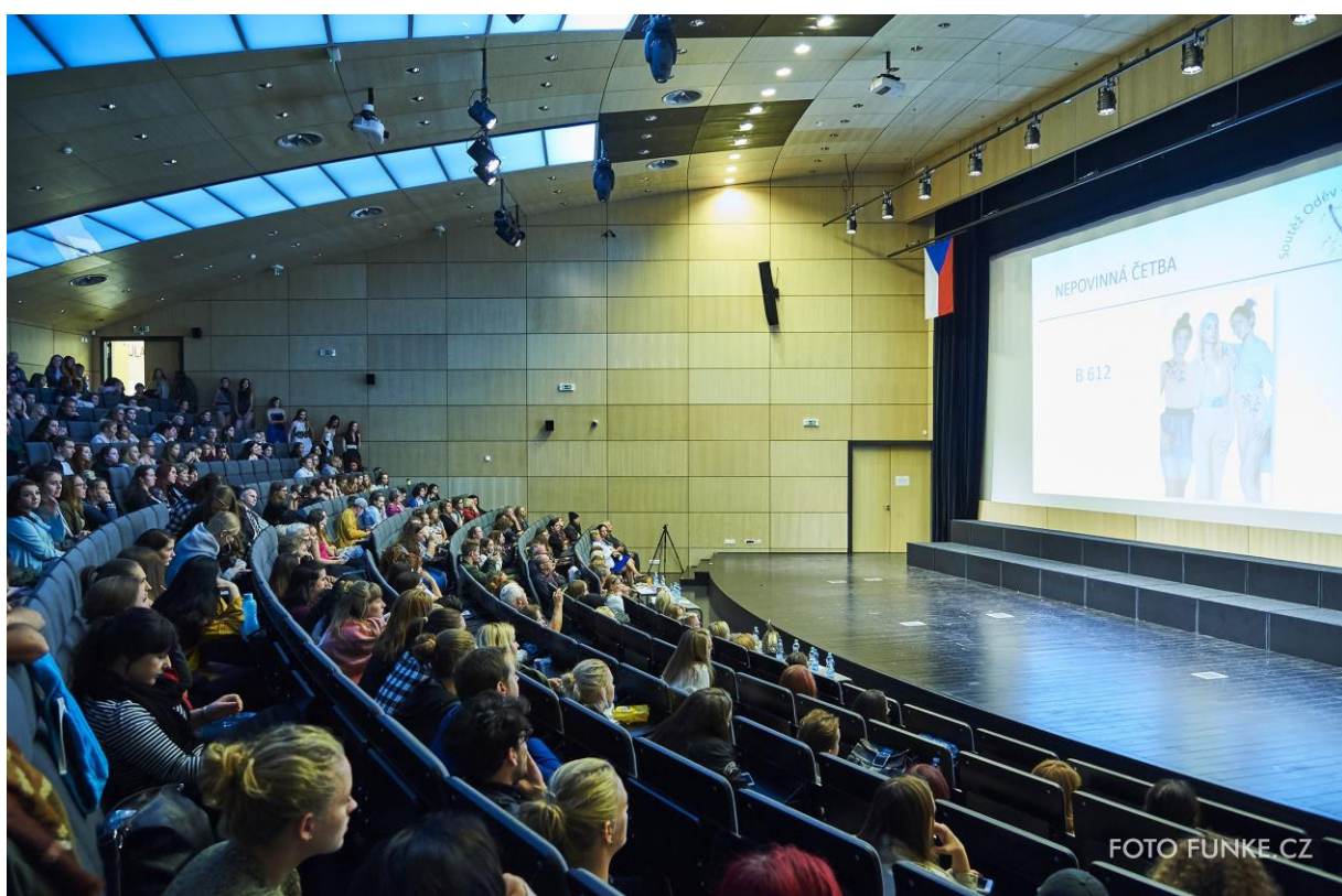
Aula budovy G TUL