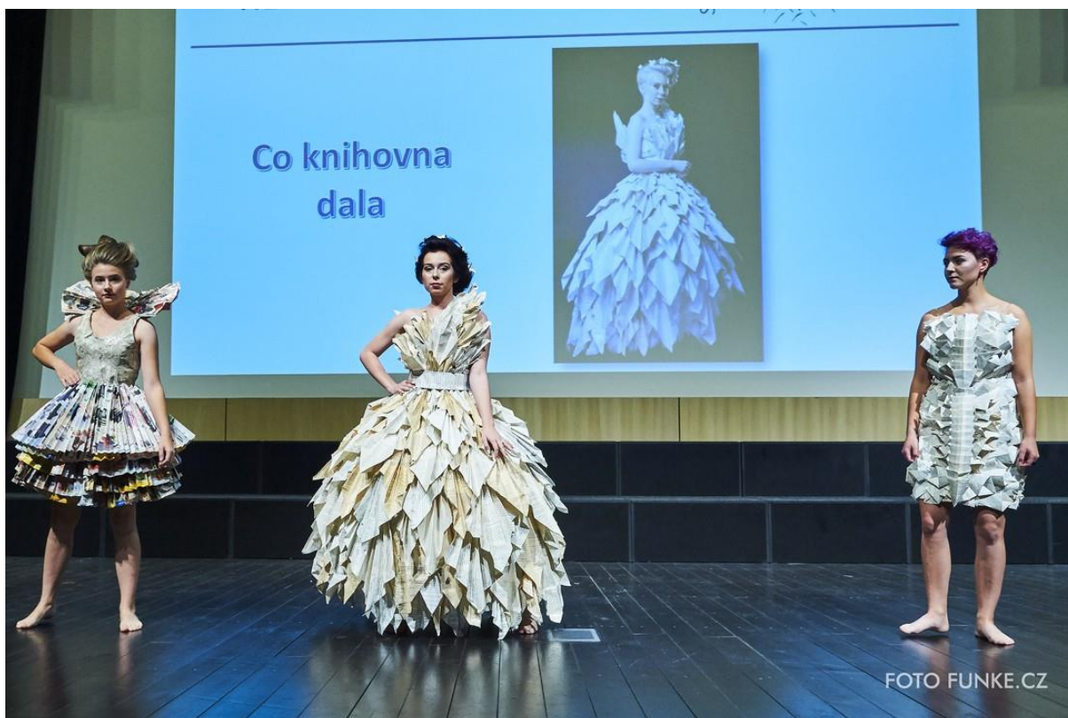
Kolekce Co knihovna dala..., 1. místo v kategorii Nepovinná četba