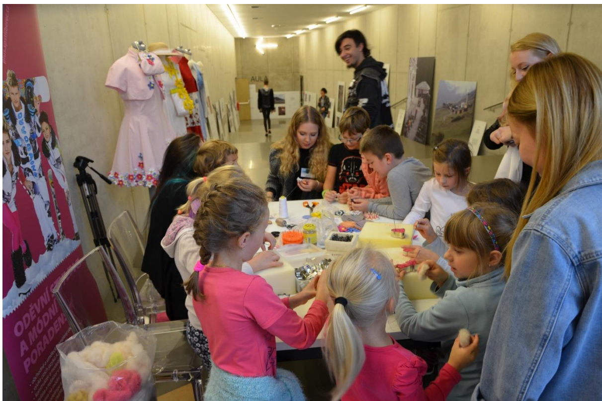
Doprovodný program - textilní techniky v praxi