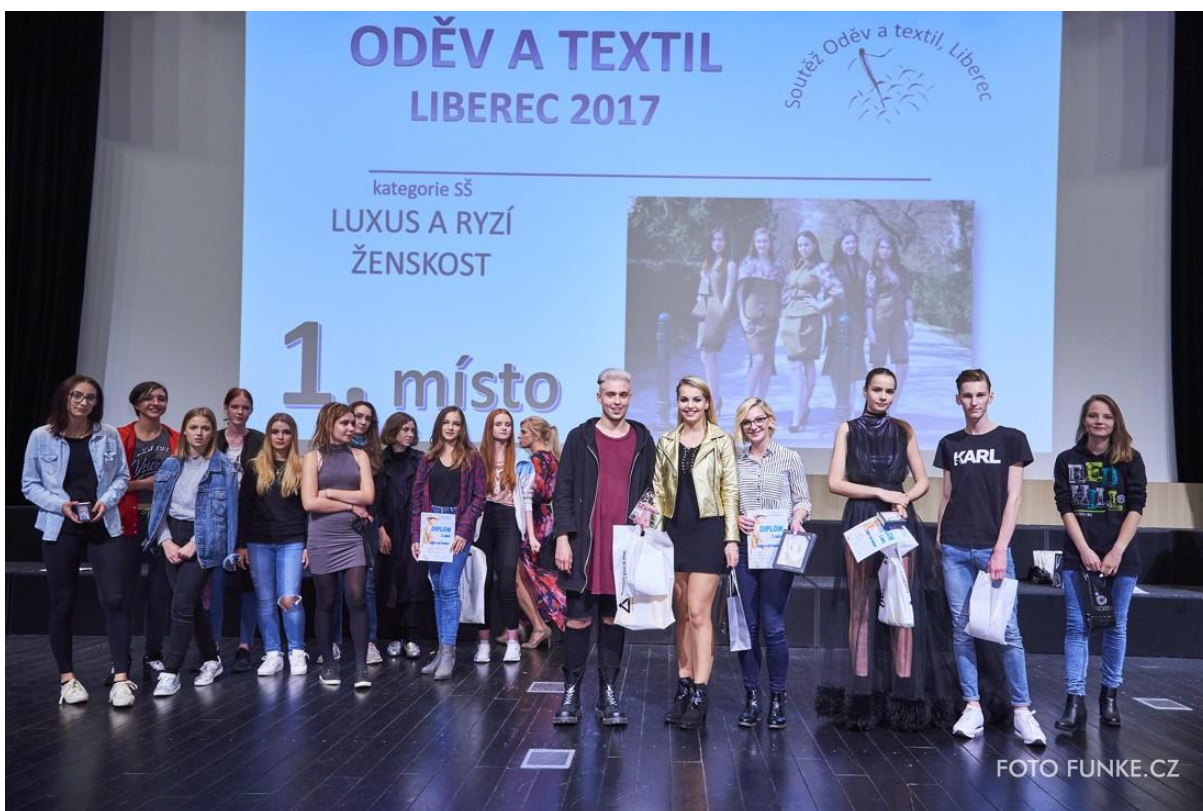
Vyhlášení výsledků kategorie Luxus a ryzí ženskost