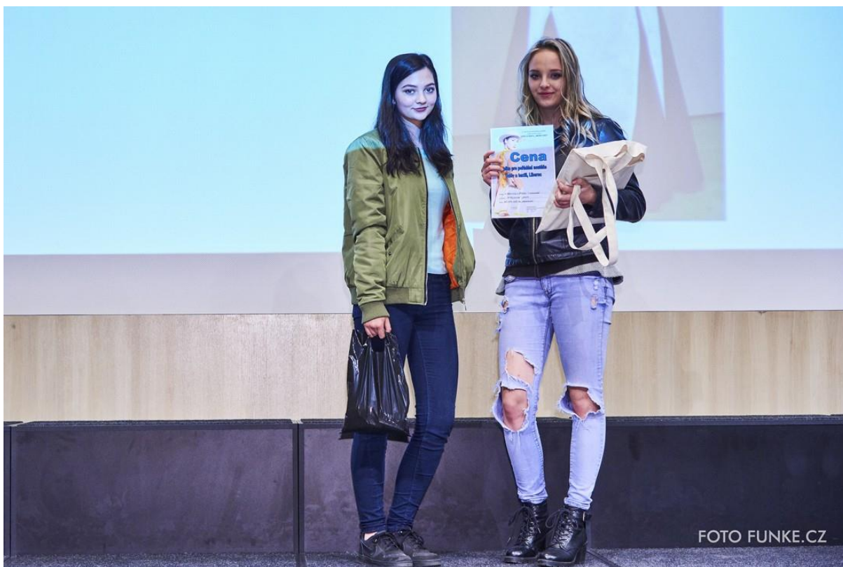
Vyhlášení ceny Spolku pro pořádání soutěže Oděv a textil, Liberec