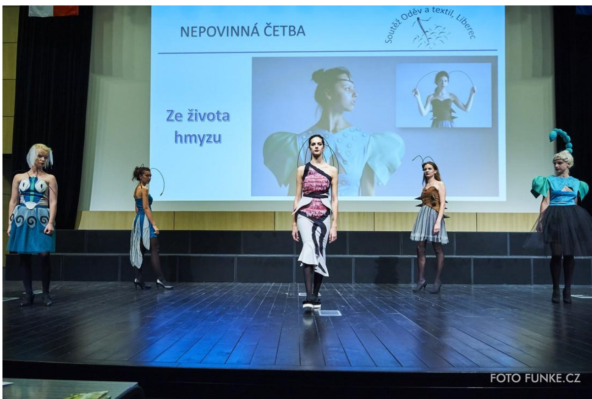
Kolekce Ze života hmyzu, 2. místo v kategorii Nepovinná četba