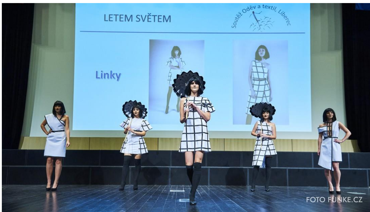
Kolekce Linky, 1. místo v kategorii Letem světem