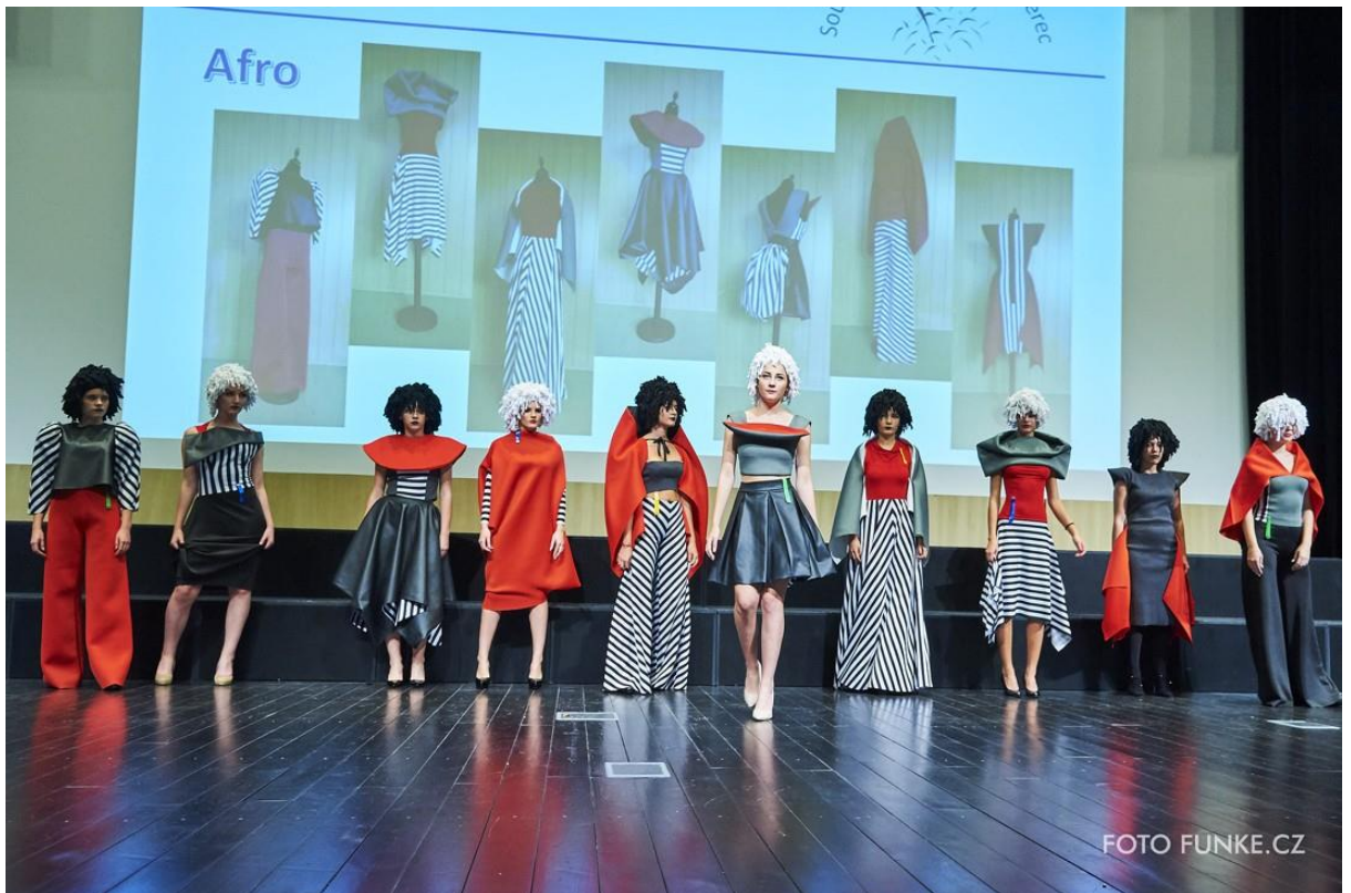
Kolekce Afro, 3. místo v kategorii Letem světem