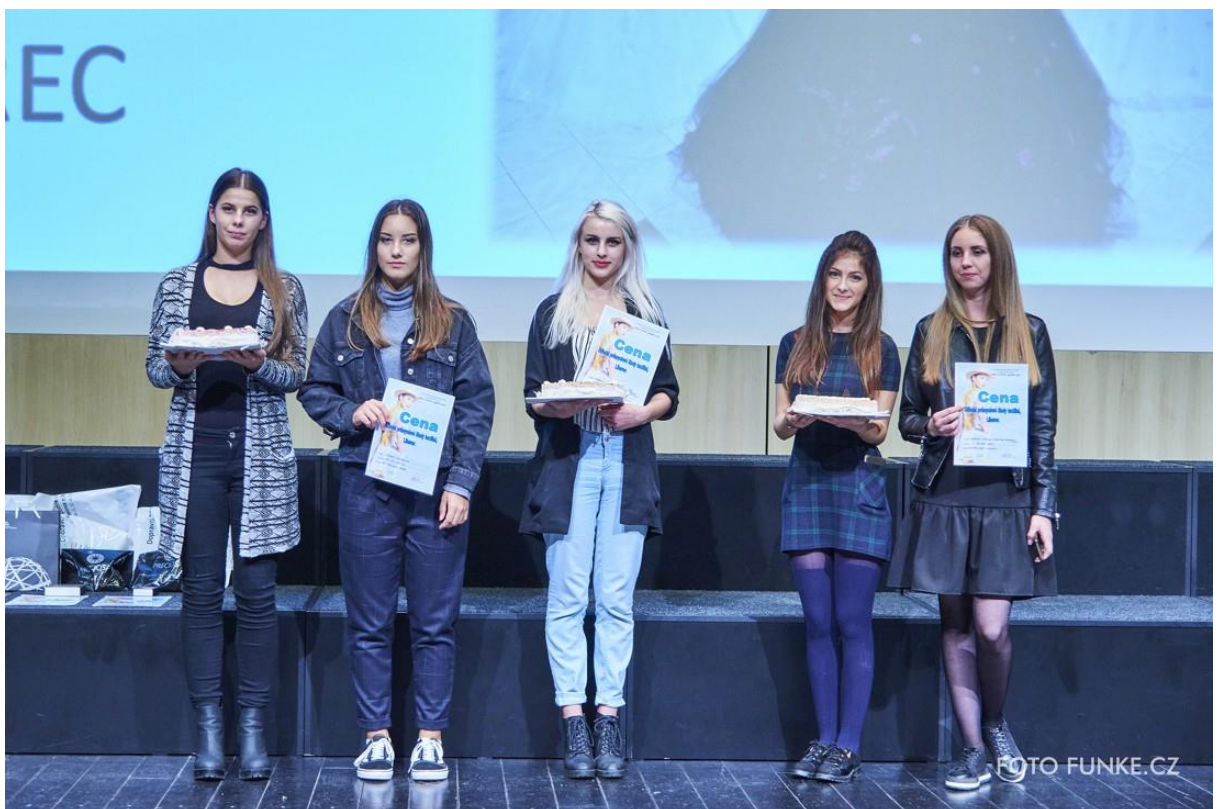
Vyhlášení cen Střední průmyslové školy textilní, Liberec