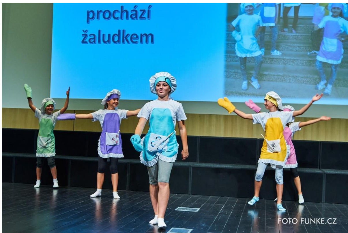
Kolekce Láška prochází žaludkem, která skončila v kategorii pro ZŠ na 3. místě