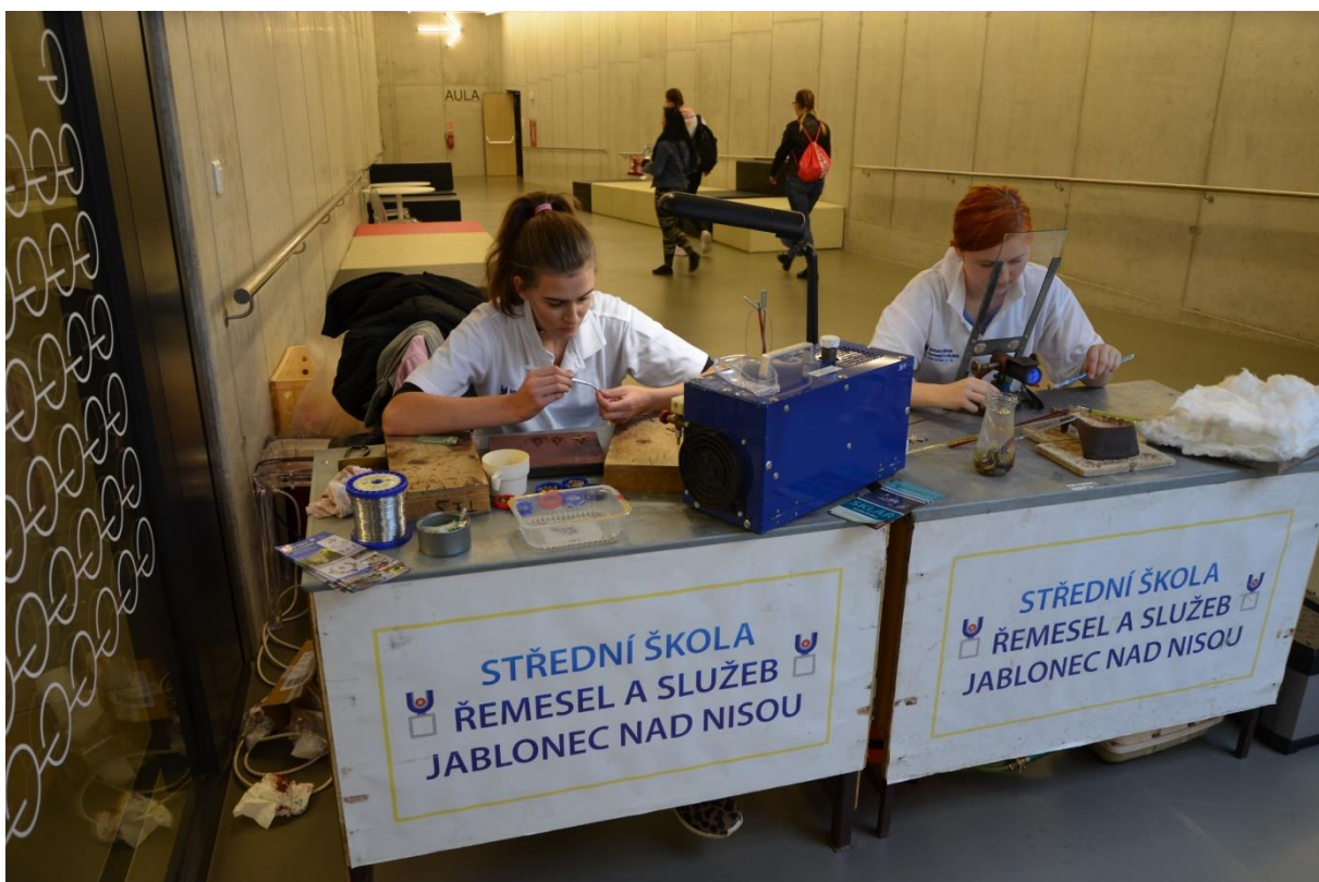
Doprovodný program - výroba bižuterie