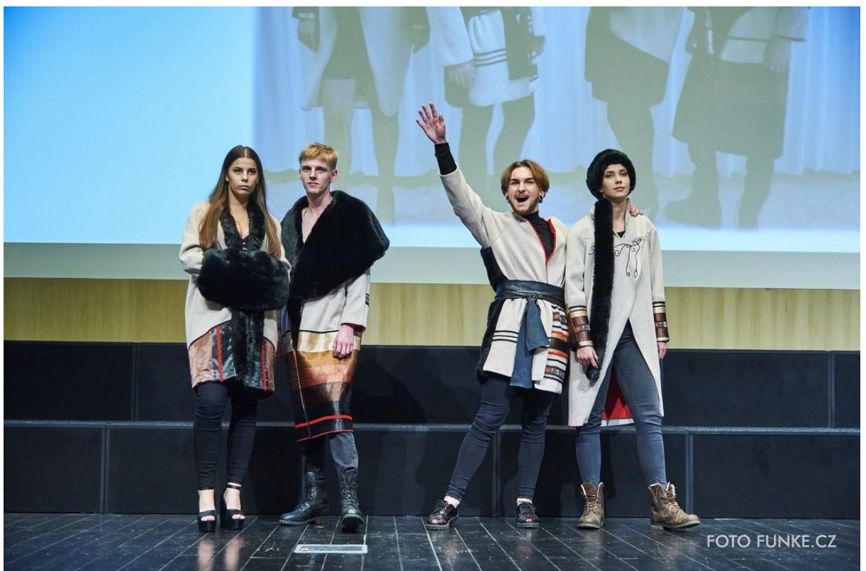
Kolekce Vladimír, 2. místo v kategorii Letem světem