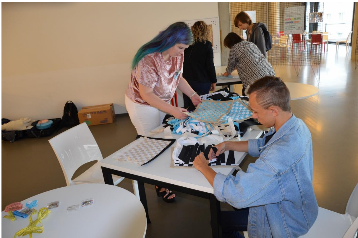
Doprovodný program - textilní workshop